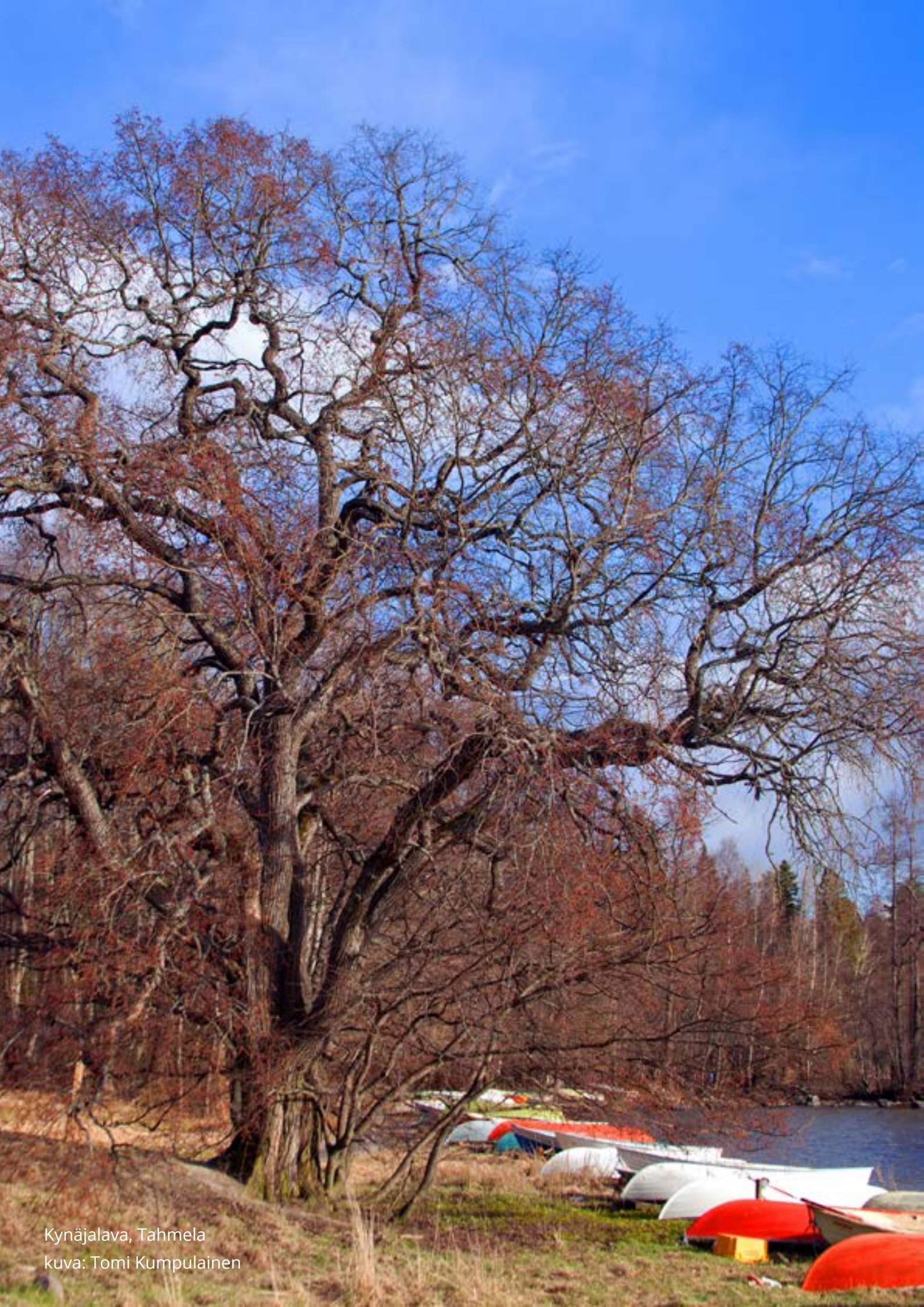
Kynäjalava, Tahmela