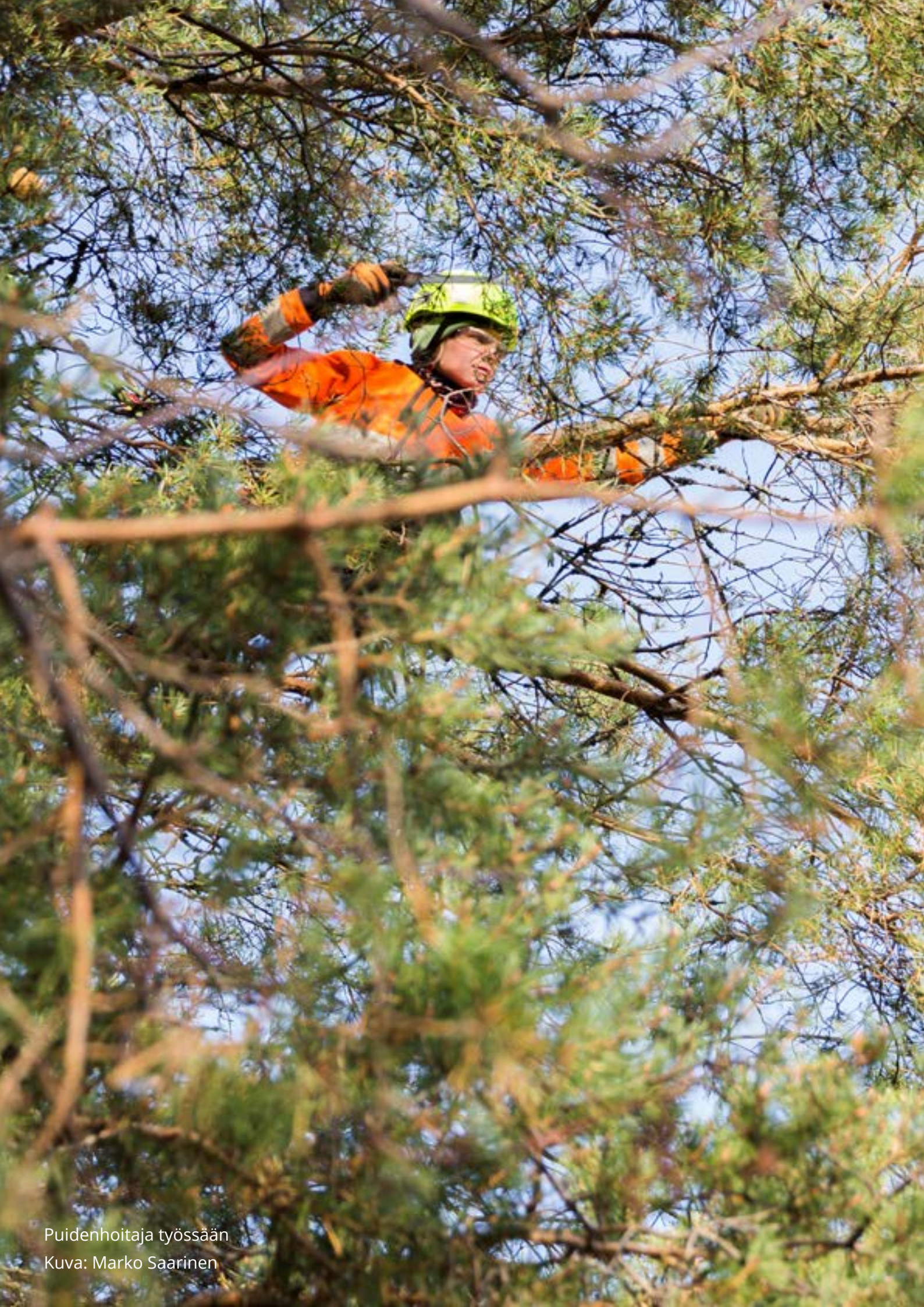
Puidenhoitaja työssään