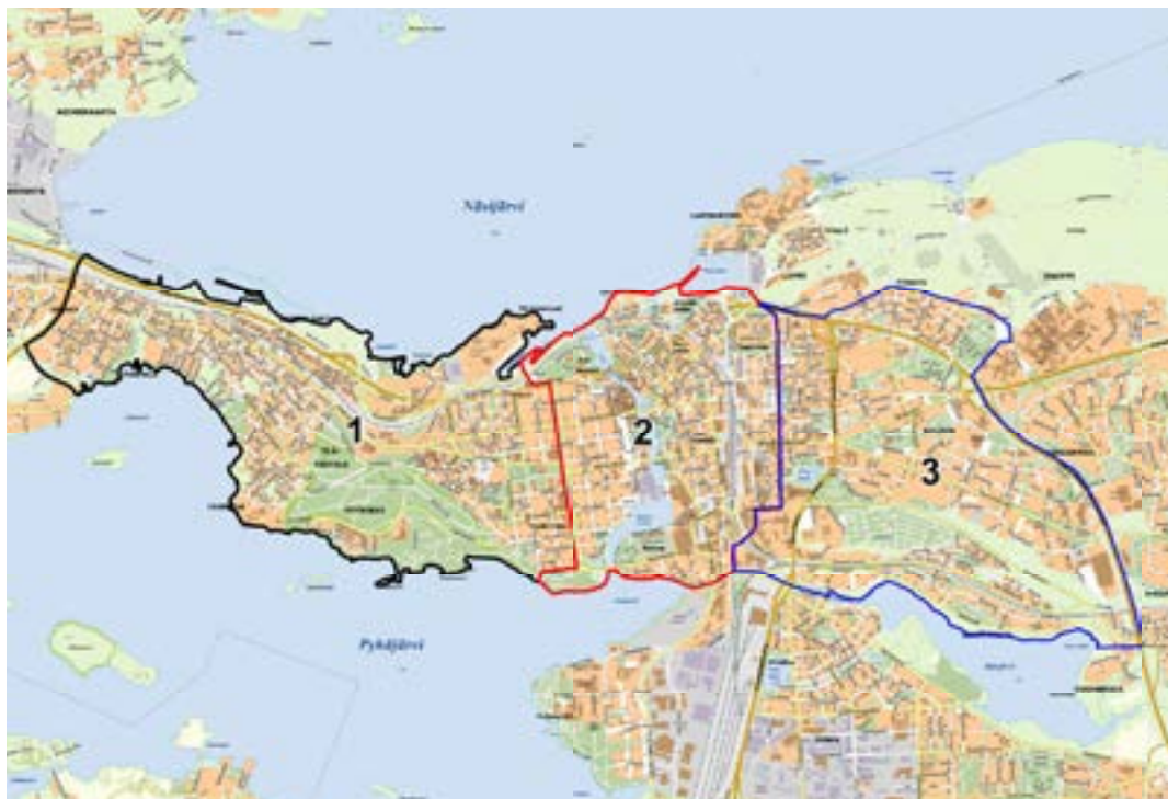
Karttaan merkityiltä kolmelta osa-alueelta on määritetty latvuspeittävyys vuonna 2020.