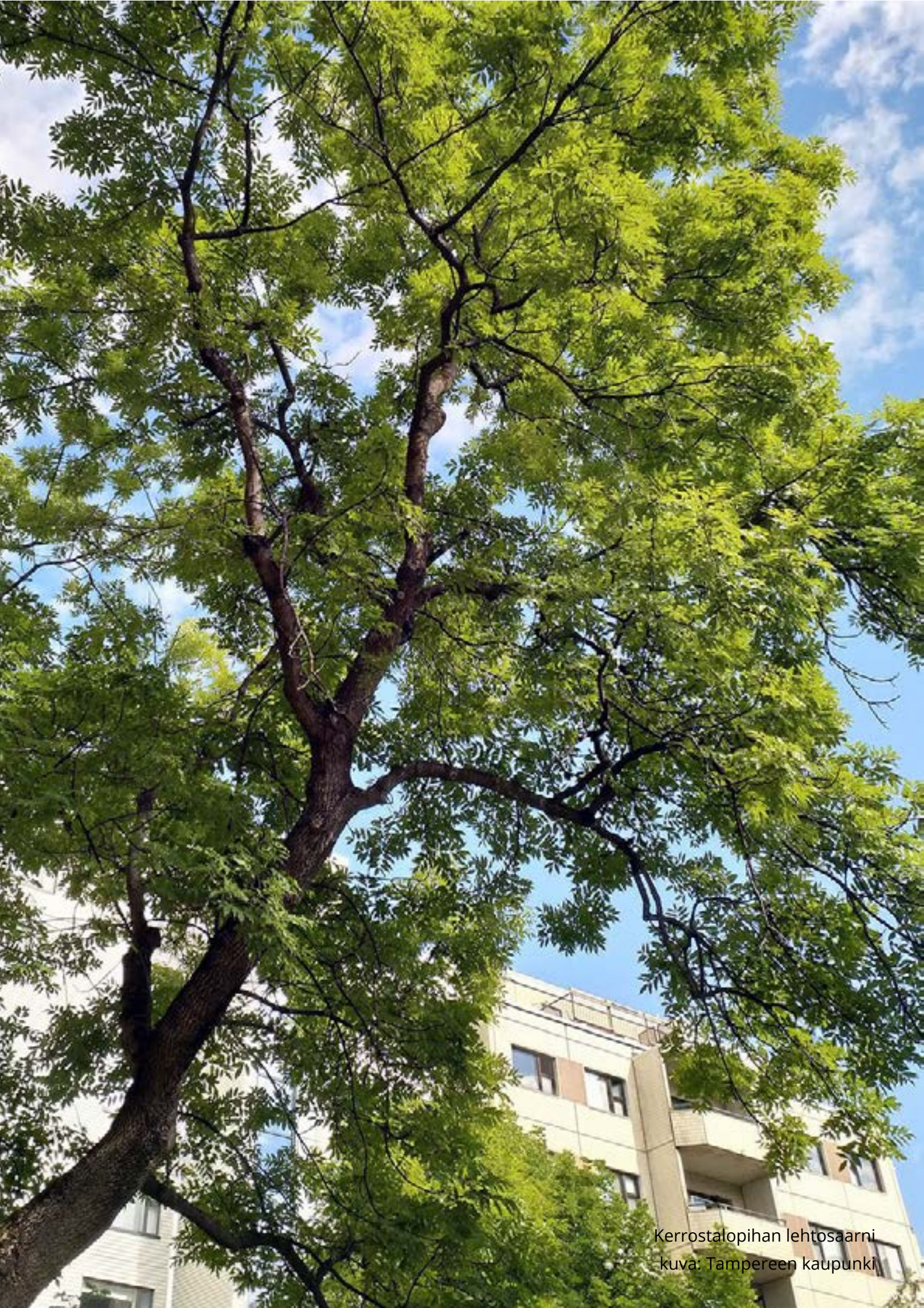
Kerrostalopihan lehtosaarni