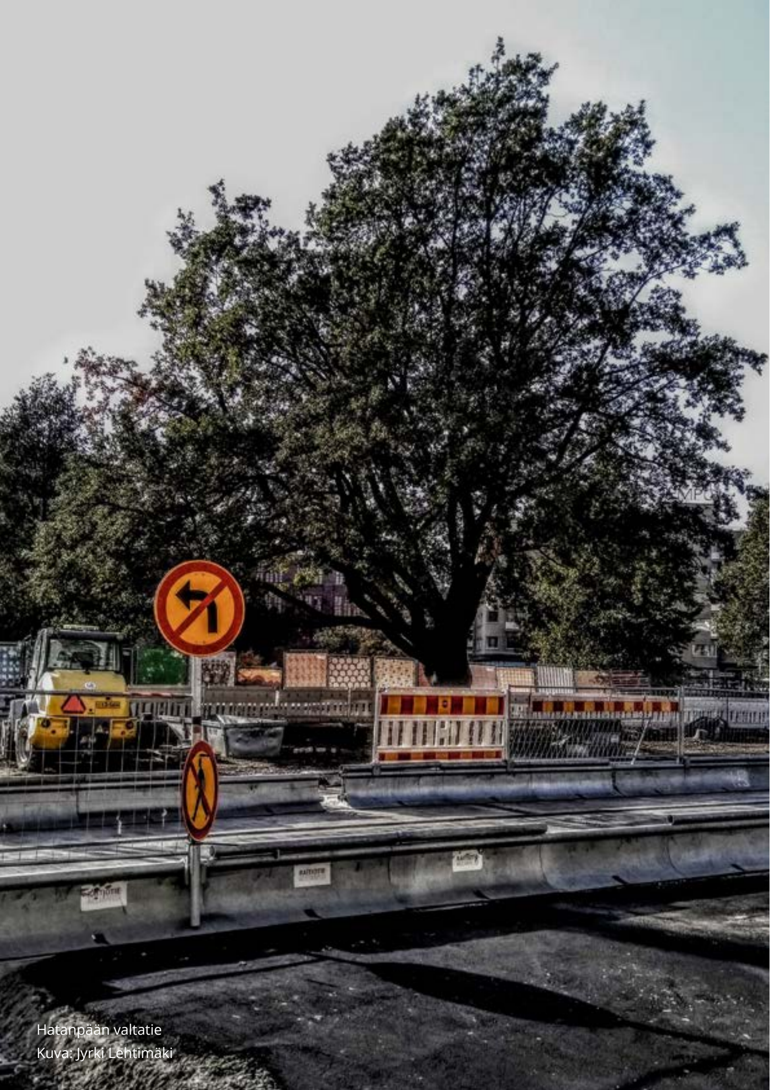
Hatanpään valtatie