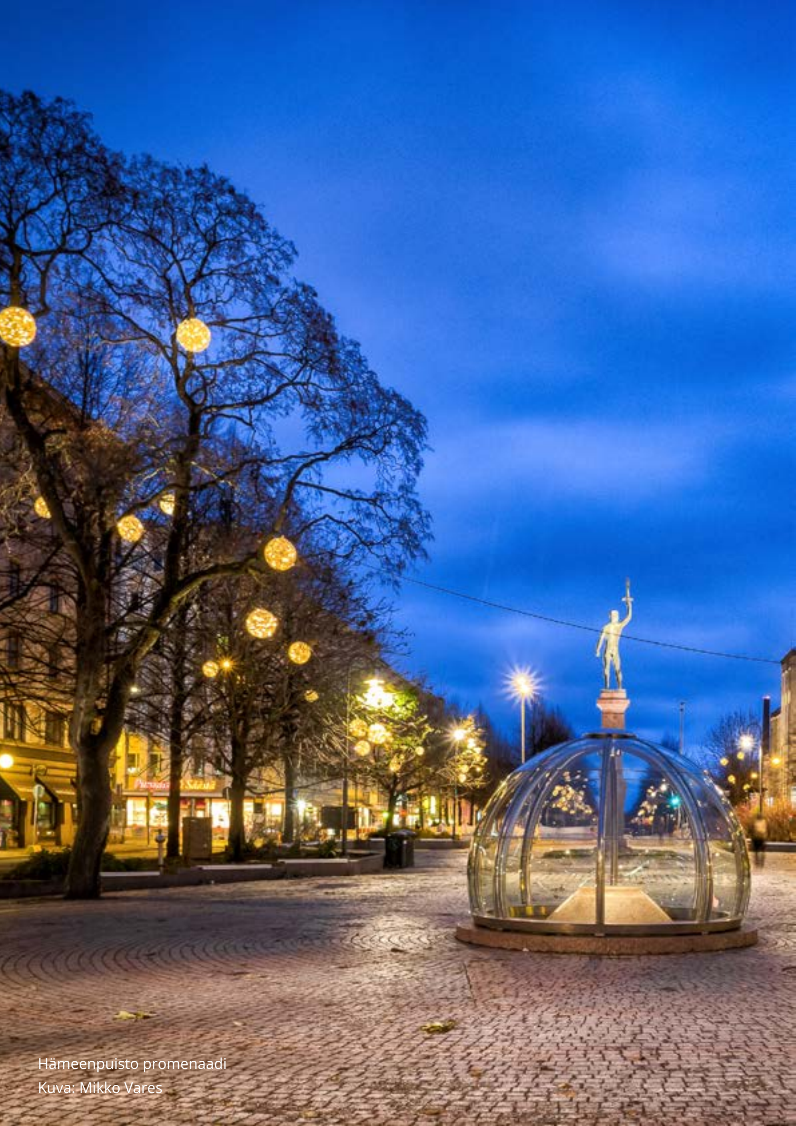
Hämeenpuisto promenaadi