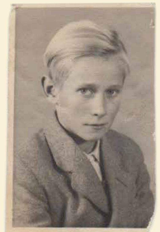
Hannu Salama 11-vuotiaana, jolloin hän aloitti Klassillisen lyseon.