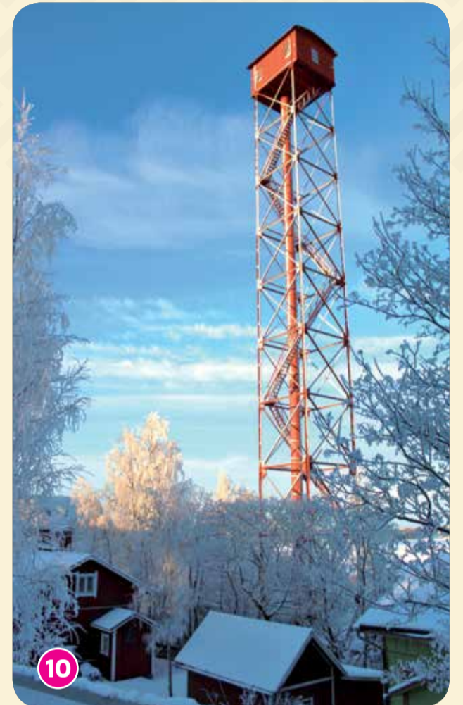
Salaman nuoruuden keskeinen paikka.