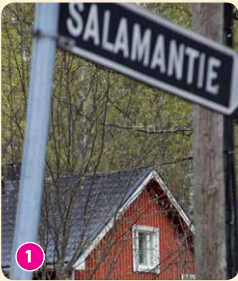
Kirjailijan ura alkoi Värmälän kylästä.