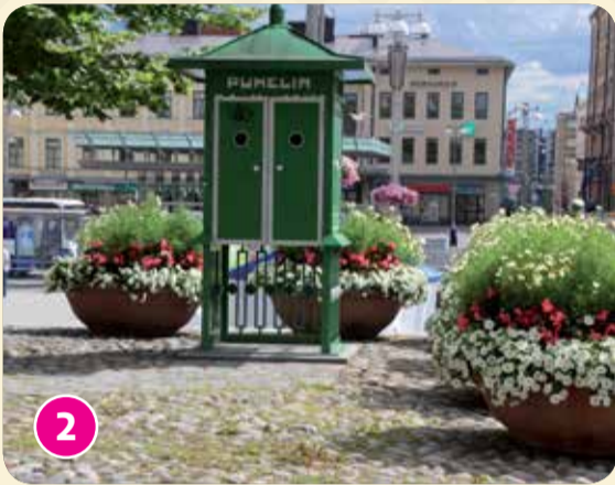
Täältä torilta lähti bussi juhannustansseihin.