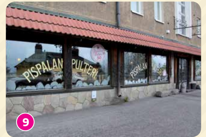
Pispalan kirjailijoiden rentoutumispaikka.