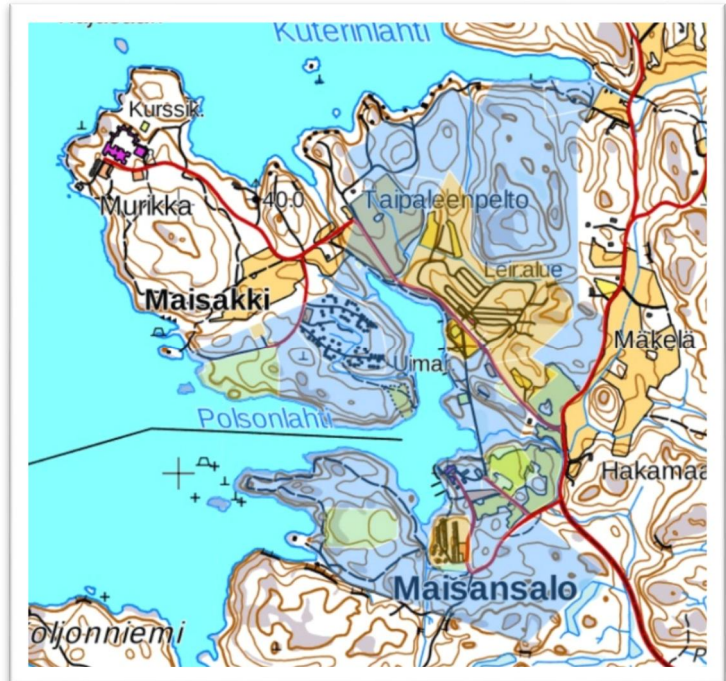
Kuva 1. Maisansalo-Murikka alue. Kartta MML

Maisansalon seutu on tällä hetkellä vain rajoitetusti satunnaisen matkailijan käytössä.