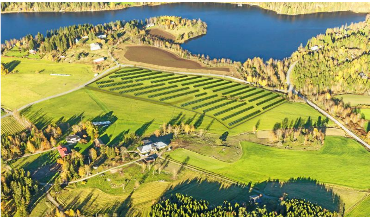
kuva 3. Aurinkopuisto Viitapohjassa. kuva: Arkta rakennuttajat Oy/MA-arkkitehdit Oy

Matkailun kannalta aurinkovoimala, paneelien välissä käyskentelevine lampaineen nähdään matkailuvalttina, jonka ympärille Viitapohjan alueelle syntyisi uutta matkailu-toimintaa nopealla tahdilla.