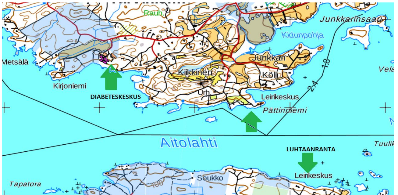
kuva 2. Seurakuntien kohteet Aitolahdella. Kartta MML

Aitolahden rannalla sijaitseva entinen Diabeteskeskus siirtyi seurakuntien omistukseen kevään 2018 aikana. Tiloja käytetään erilaisiin tarpeisiin entisen omistajan ja nykyisen omistajan käytön mukaan. Seurakunnat varaavat juhla- ja kokouskäyttöön runsaasti tiloja. Tilojen majoituskapasiteetista varataan 50 paikkaa avoimeen, kaikille matkailijoille tarkoitettuun vuokratyttöön. Tilojen kehittäminen edelleen jatkuu vuoden 2018 jälkeen, jolloin tilojen käytöstä on saatu tarvittavat kokemukset.