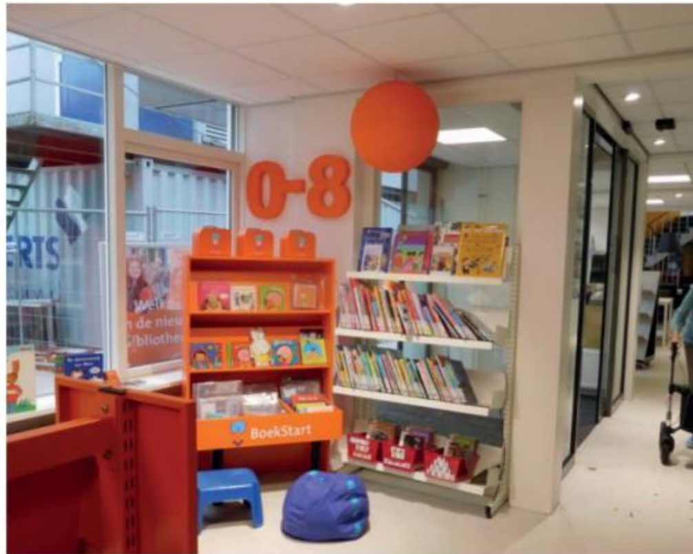
Tiloissa sijaitsee myös kaupungin sivukirjasto, joka on avoin kaikille alueen asukkaille.