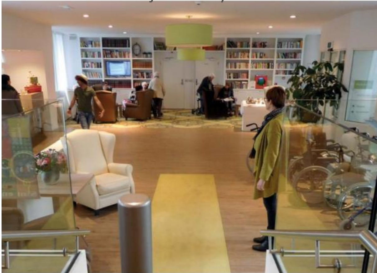
Yhteinen ala-aulatila. Taustalla kirjojen vaihtoniste.