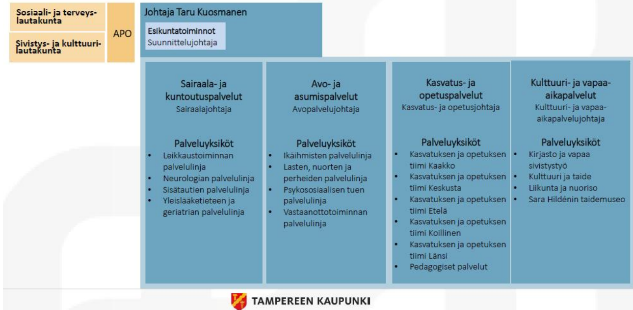
Kuvio 1. Alustava suunnitelma Tampereen kaupungin hyvinvoinnin palvelualueen rakenteesta. (Kaupunginhallituksen suunnittelukokous 19.9.2016)

Kaupunki-järjestö -yhteistyön kehittämisprosessi on herättänyt paljon kiinnostusta. Tavoitteena on ollut kuvata malli tulevaisuuden yhteistyön toteuttamiseen sekä saattaa yhteen yhteistyön kehittämisestä kiinnostuneet, yhteisen tahtotilan omaavat ihmiset niin kaupungin kuin järjestöjen osalta. Malli ja kuvaukset antavat suunnan ja ne ohjaavat ensimmäisille askelmille, mutta jättävät myös mahdollisuuksia ja valinnanvapauksia toimijoille.