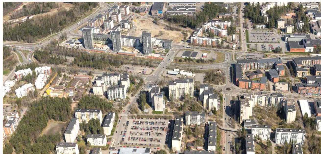
Ote viistoilmakuvasta kilpailualueen kohdalta.