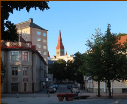
Ojakatu Lars Sonckin Jussinkylän asemakaavassa 1907 Rongankadun päässä olevine aukioineen ja katumimiseen