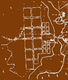
Satakunnankadun ja Aleksanterinkadun risteys-nykyisinkin notkossa