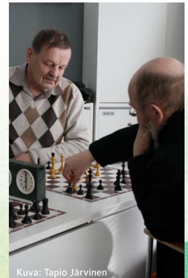
Kuva: Tapio Järvinen