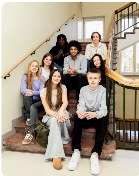
Kuva: Laura Happonen