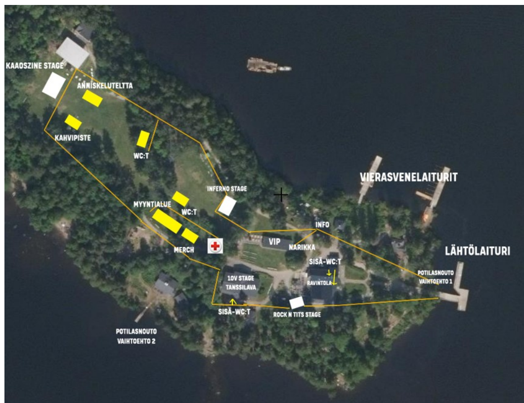
Kuva 1. Tapahtuma-alue

Äänentoistoa testataan torstaina 13.8.2026 kello 16.00–20.00. Äänentoiston testausta tehdään perjantaina 14.8.2026 kello 12.00 alkaen ja ensimmäinen esiintyjä esiintyy kello 16.30. Ohjelma päättyy kello 24.00. Lauantaina 15.8.2026 äänentoiston testausta tehdään kello 12.00 alkaen ja ensimmäinen esiintyjä esiintyy kello 15.30. Ohjelma päättyy kello 24.00.