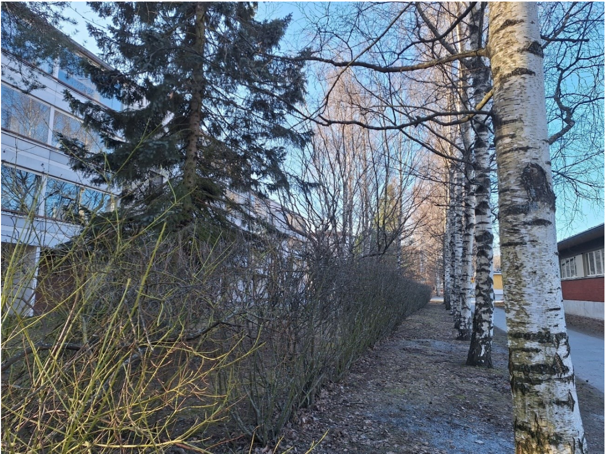
Kuva 3.4. Amurin selvitysalueen kasvillisuus koostui pääosin alueelle istutetuista puista ja pensaista.