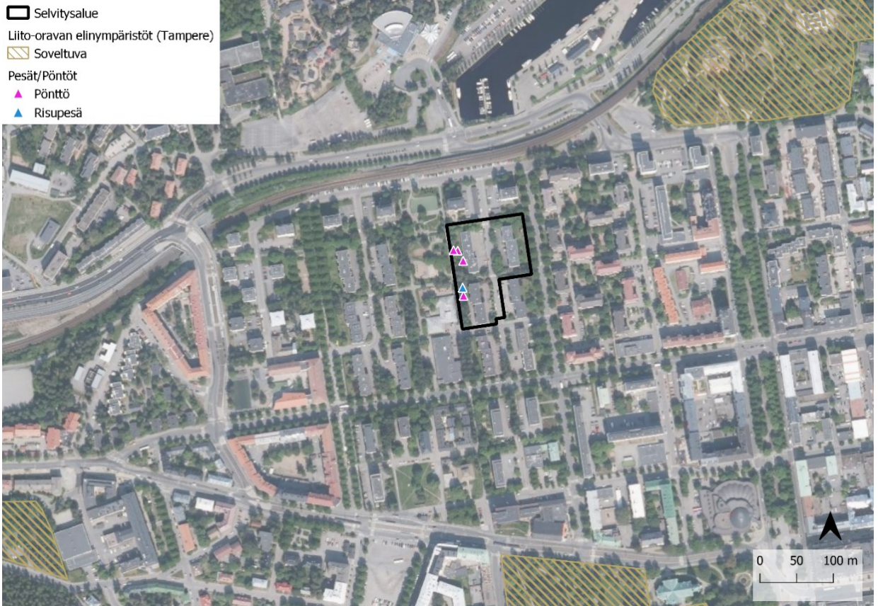
Kuva 3.3. Liito-oravaselvityksessä havaitut pönttöt ja alueen sijainti suhteessa lajille soveltuviin elinympäristöihin.