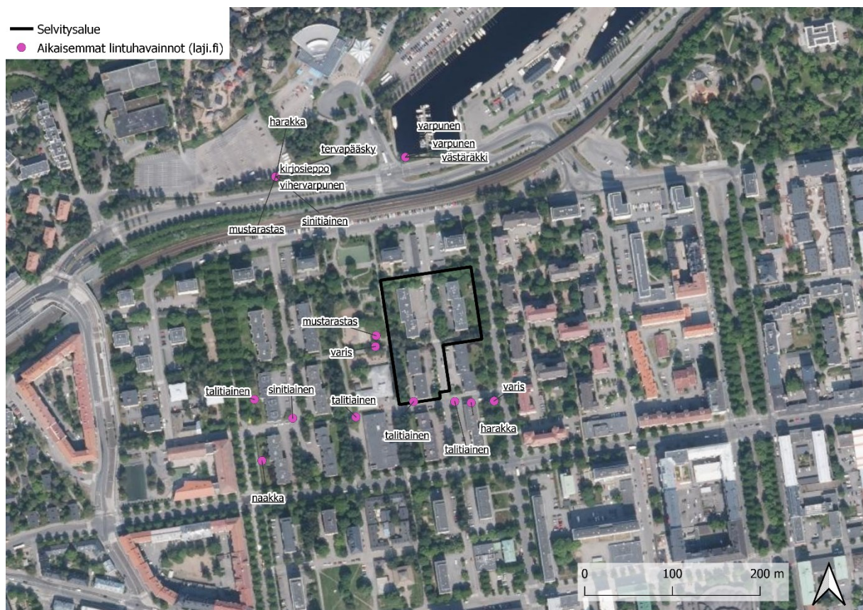
Kuva 4.1. Selvitysalueen ympäristön aiemmat lajihavaintotiedot.

Tampereen Kaupungin linnustoindikaattorin lajistaselvityksen mukaan (Pirkanmaan Lintutieteellinen Yhdistys RY, 2023) Amurin alueella, noin 300 metrin säteellä selvitysalueen ympäriltä, tehtiin havaintoja yhdestätoista lintulajista ja yhteensä 62 yksilöstä. Yksilömäärällisesti runsaimpina havaittiin erittäin uhanalaisia lajeja tervapääskyä ja varpusta. Lisäksi havaittiin yksi västäräkki, joka on silmälläpidettävä laji.