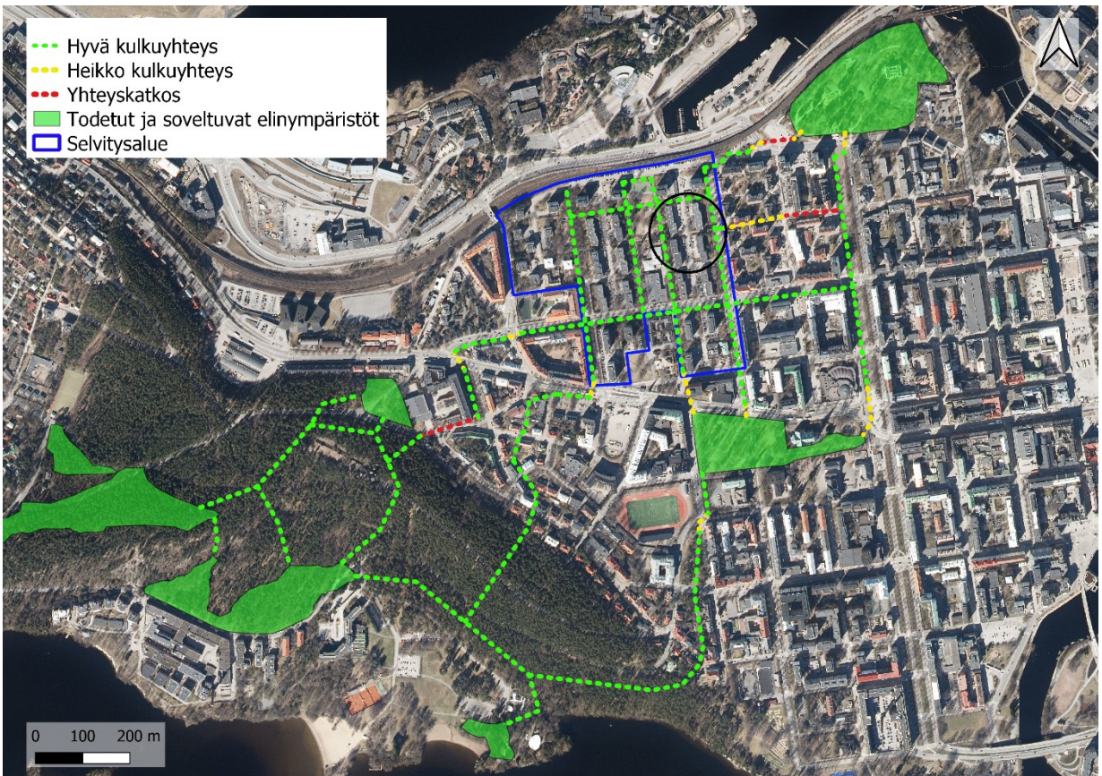
Kuva 3.2 Vuoden 2023 liito-oravaselvityksessä arvioidut liito-oravan mahdolliset kulkuyhteydet Amurin alueella. Asemakaava-alueen 9004 sijainti on ympäröity kuvaan mustalla.