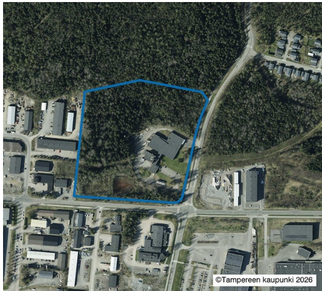
Kaavan suunnittelualue ilmakuvassa