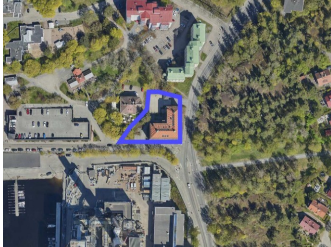
Suunnittelualue ilmakuvassa ©Tampereen kaupunki 2026.