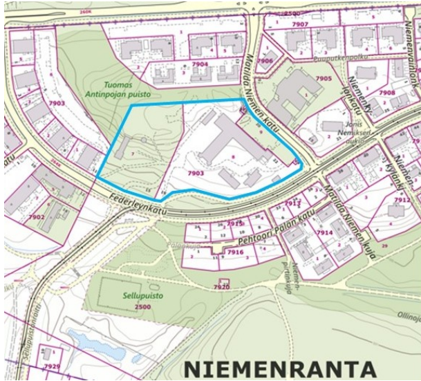
Asemakaavarajaus virastokartan päällä. ©Tampereen kaupunki.