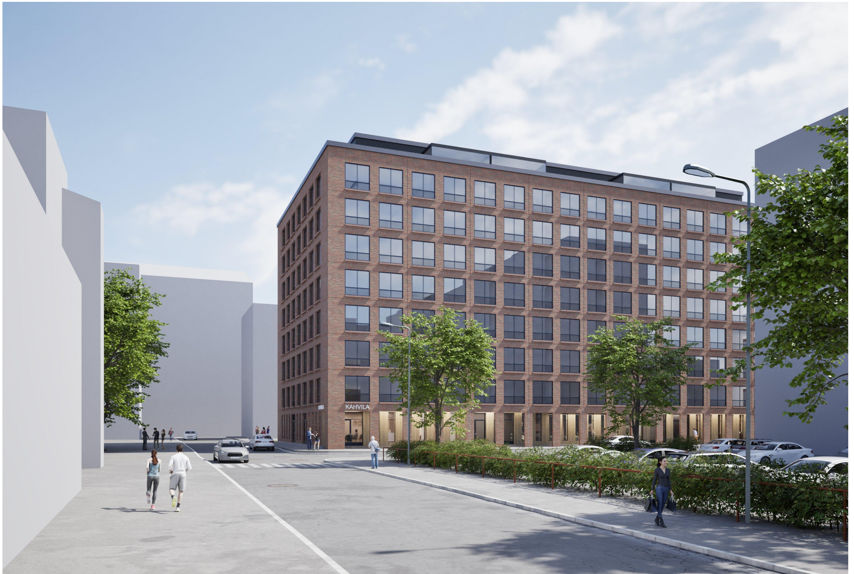
Näkymäkuva Vellamonkadulta itään 25015119 Mäkipäänkatu 39-41 1.4.2026