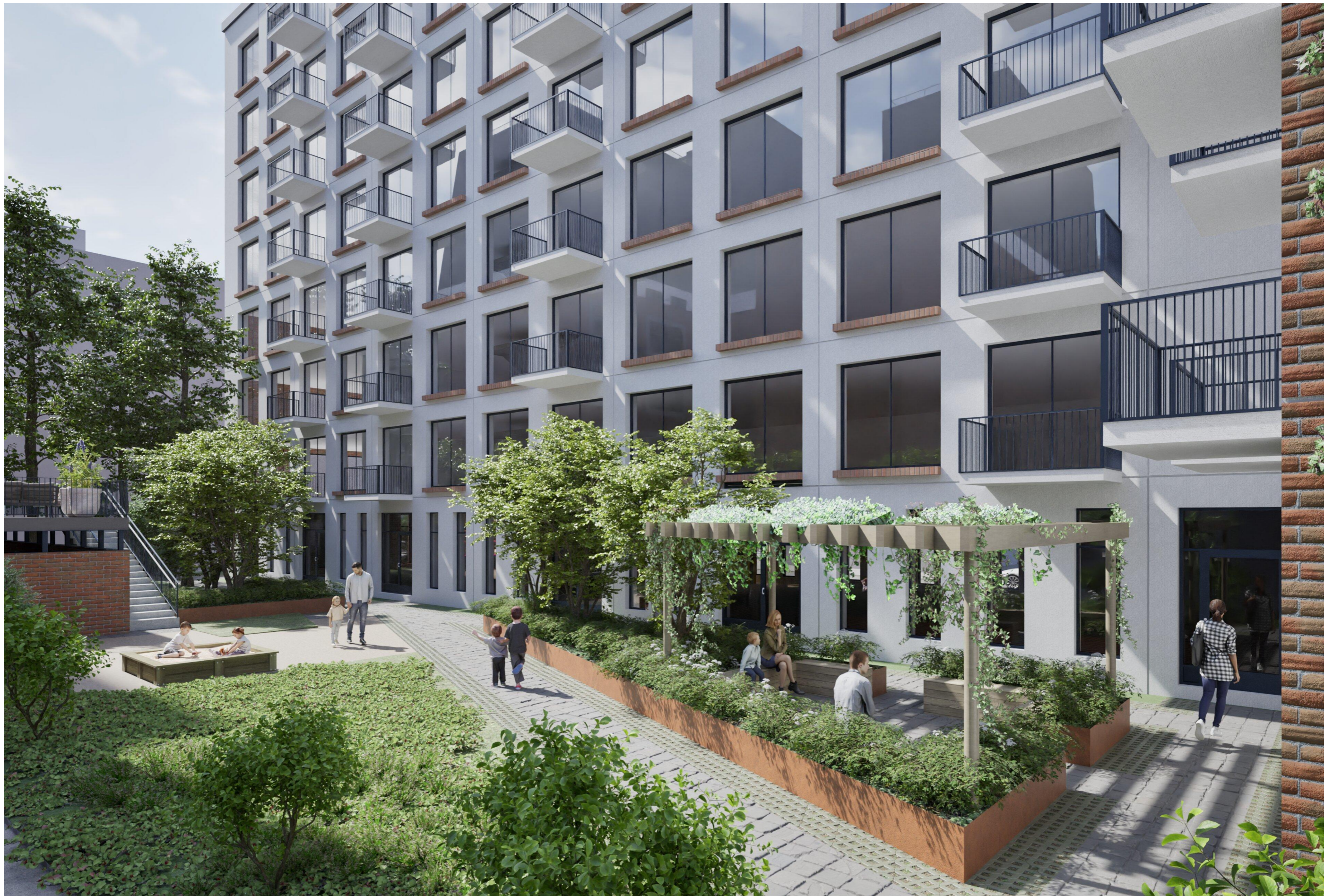
Näkymäkuva sisäpihalta 25015119 Mäkipäänkatu 39-41 1.4.2026