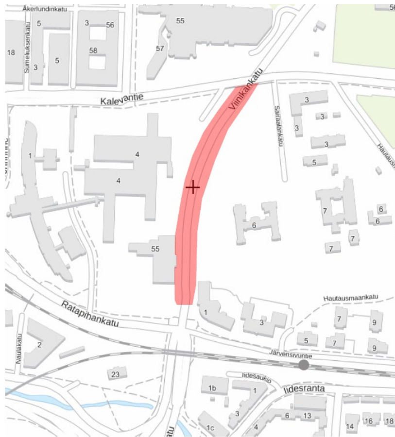
Kuva 1. Työmaa-alue on esitetty punaisella rajauksella.