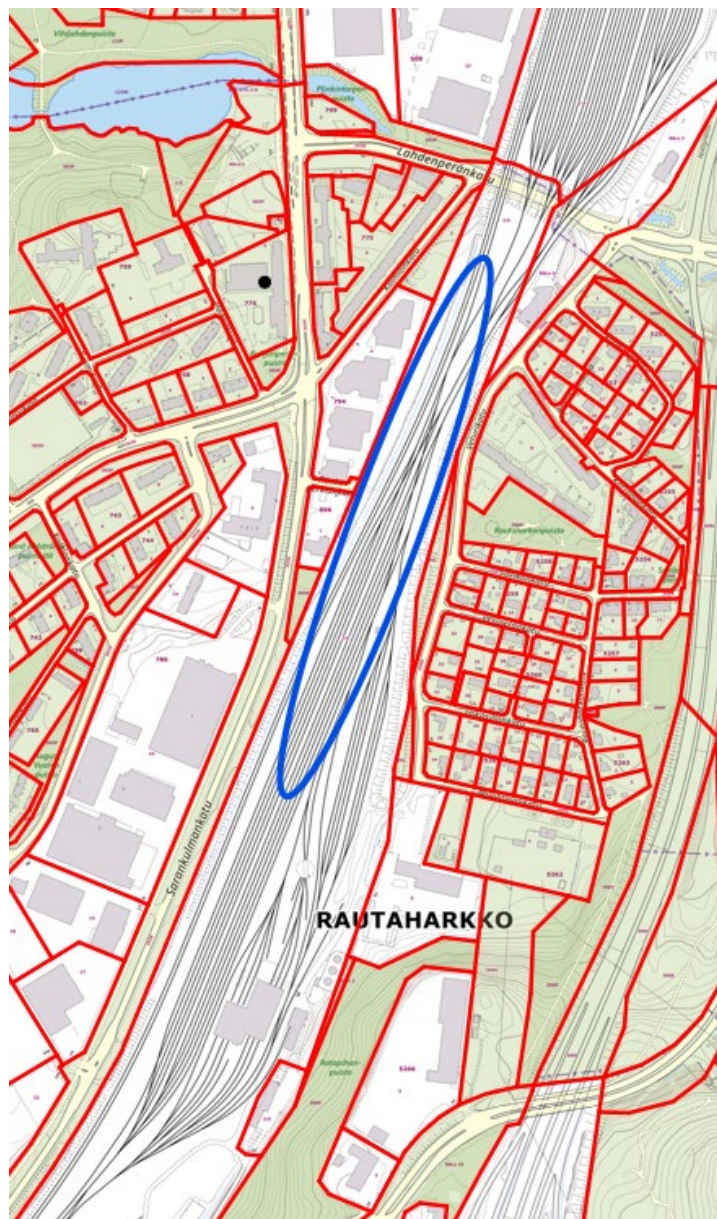
Kuva 1. Työskentelyalueen suurpiirteinen sijainti ratapihalla on esitetty sinisellä.

GRK Suomi Oy tekee ratapihalla päällysrakenteenvaihtoa. Rakennuttajana on Väylävirasto. Osoitteena ilmoituksessa on Veturikatu 15. Työskentelyalue on esitetty kuvassa 1. Työskentelyalue sijoittuu etelä-pohjoissuunnassa Lahdenperäncadun ja Sarankulmankatu 8 välille.