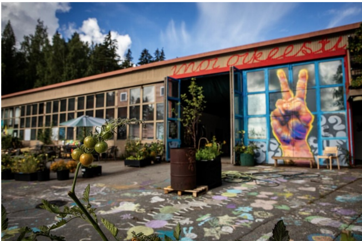
(Muut kuin talvikuvat: kuvaaja: Teemu Keskinen)