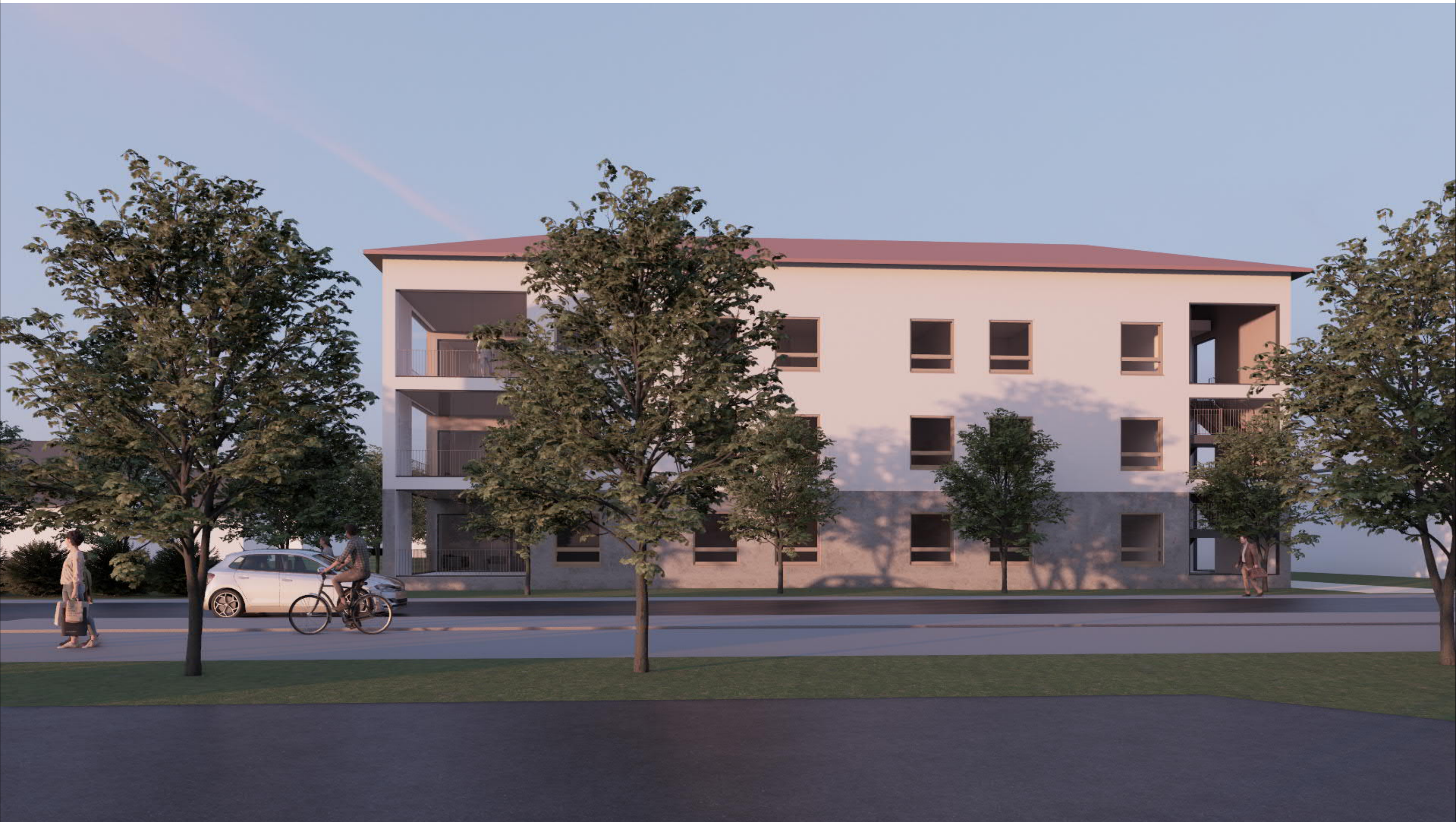
Kissanmaankatu Hoiva Näkymä aukiolta