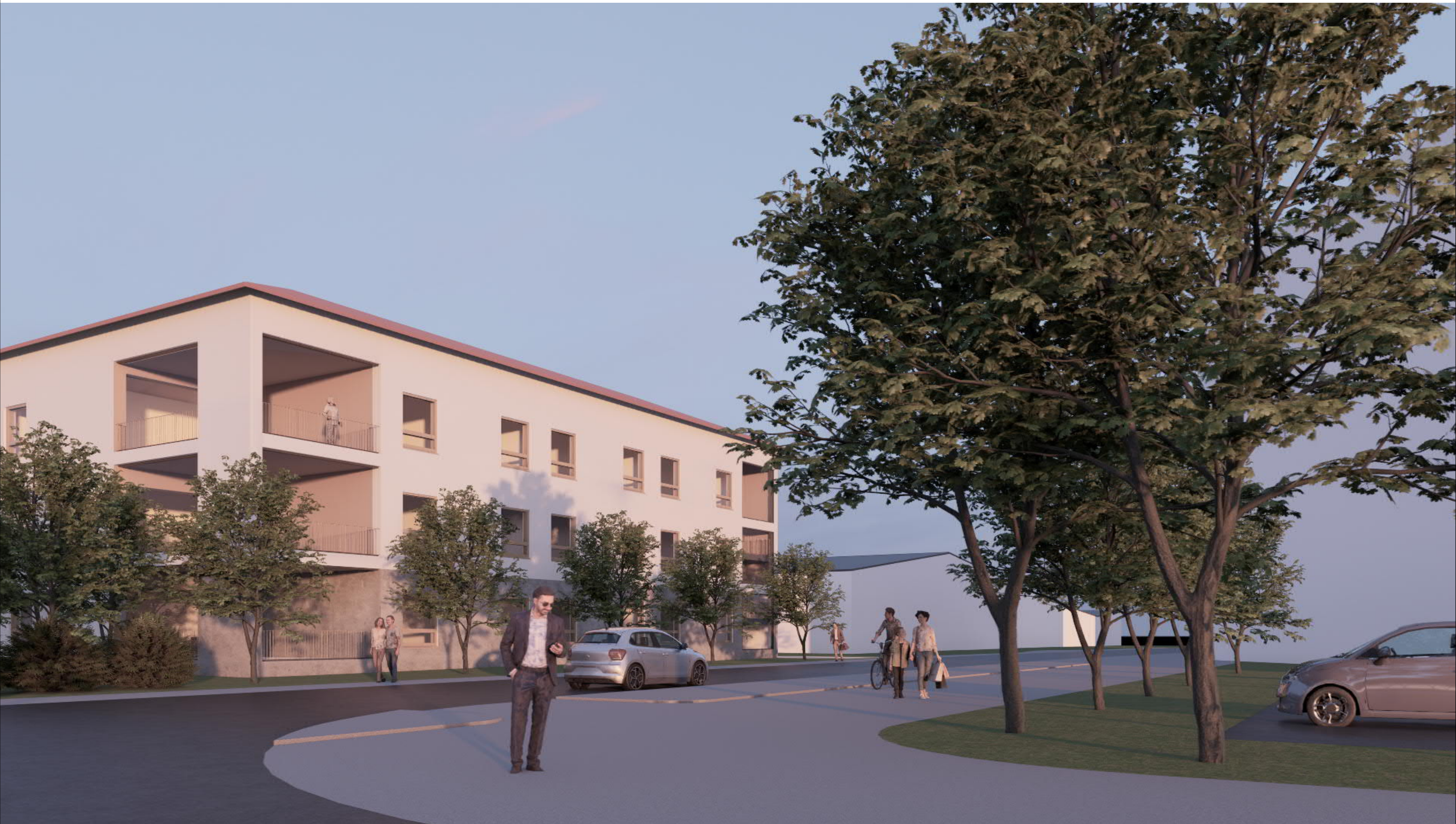
Kissanmaankatu Hoiva Näkymä risteysalueelta