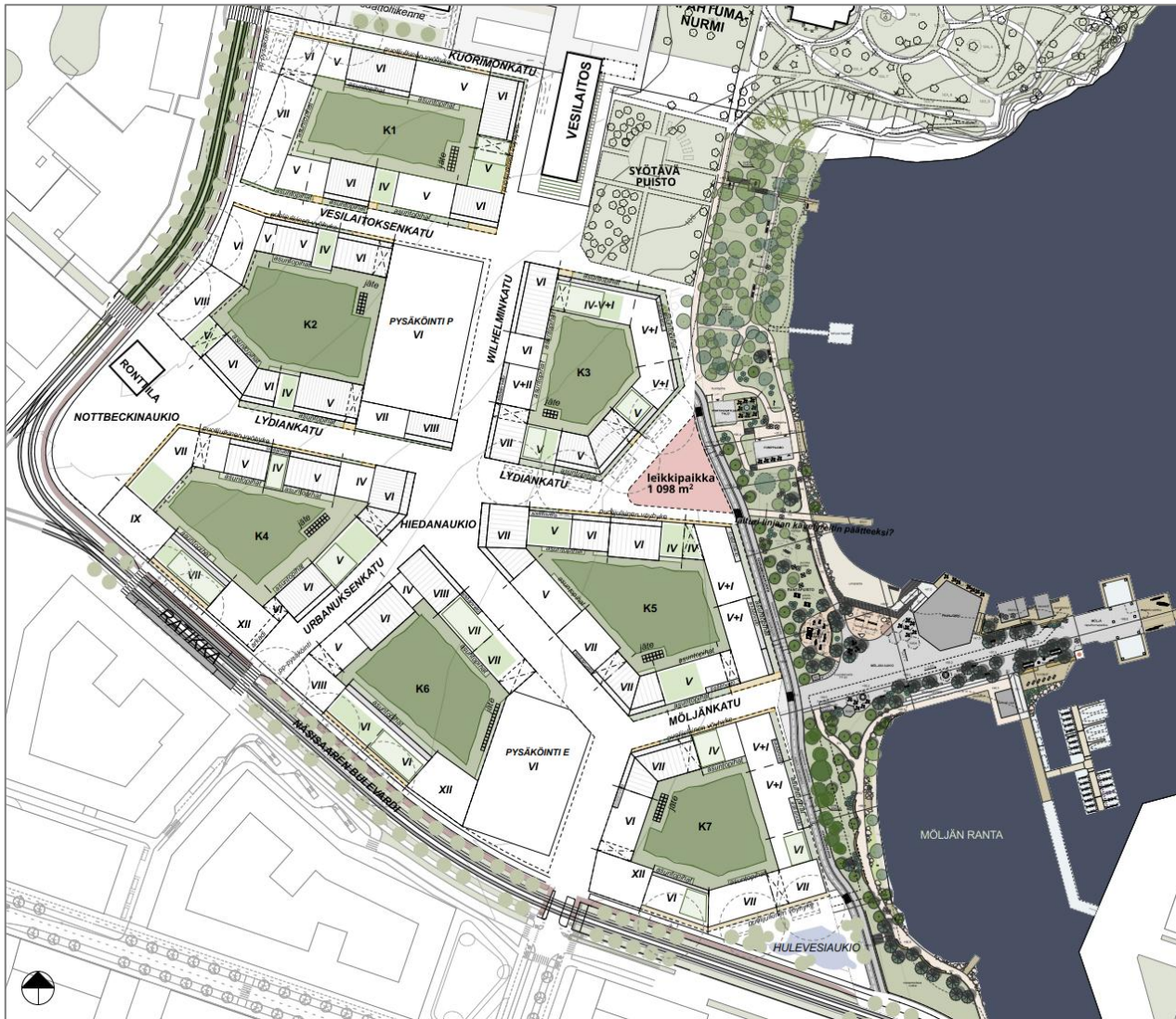
Kuva 1. Ote kaavan valmisteluvaiheen viitesuunnitelmasta (Oopea 19.12.2025)

Tampereen karttapalvelussa on taso Raitiotien tärinän ja runkomelun riskivyyhykkeet . Tarkasteltavan kaava-alueen kohdalla riskivyyhyke ulottuu enintään 10 metrin etäisyydelle raiteista.