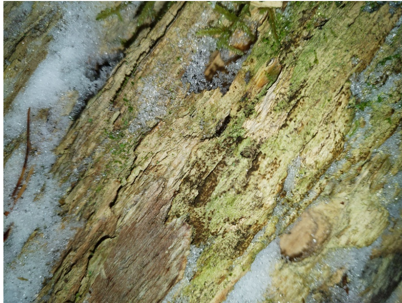
Kuva 1. Itujyväsiä lahopuun pinnalla