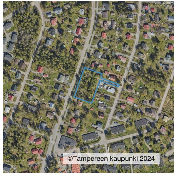
Suunnittelualan rajaus ilmakuvassa