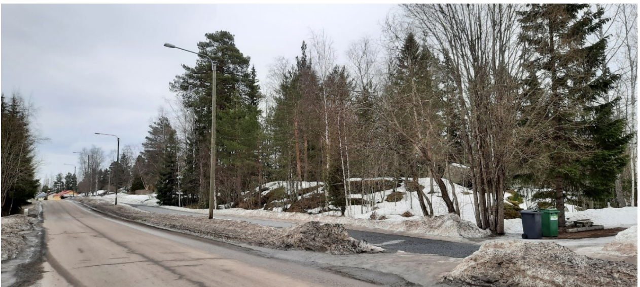
Kuva 1 Selvitysalue kuvattuna Ikurintieltä kohti koillista keväällä 2022. Selvitysalue näkyy kuvassa tien oikealla puolella.

Kuokkakuistikkoon sijoittuva liito-oravalle soveltuva kulkuyhteys tulisi säilyttää ja yhteyttä parantaa puiston itäosassa. Tavoitteena tulisi olla säilyttää mahdollisimman paljon olemassa olevaa puustoa ja parantaa yhteyttä uusilla, istutettavilla puilla. Kuokkakuistoon sijoittuu myös yleiskaavan ekologinen yhteys, jonka määräyksessä todetaan, että ekologinen yhteys on säilytettävä mahdollisimman leveänä ja kehitettävä kullekin yhteystyypille ominaisella tavalla. Puustoisia ekologisia yhteyksiä on kehitettävä latvuspeitteisyydeltään yhtenäisiksi ja lajistoltaan monipuolisiksi. Kuokkakuiston liito-oravan kulkureitti on selvitysalueen tärkein kulkureitti, koska se sijoittuu yleisille alueille, jolloin kulkuyhteyden toimivuus on mahdollista turvata tulevaisuudessakin ja sen kehittäminen on helpompaa kuin yksityisillä alueilla.