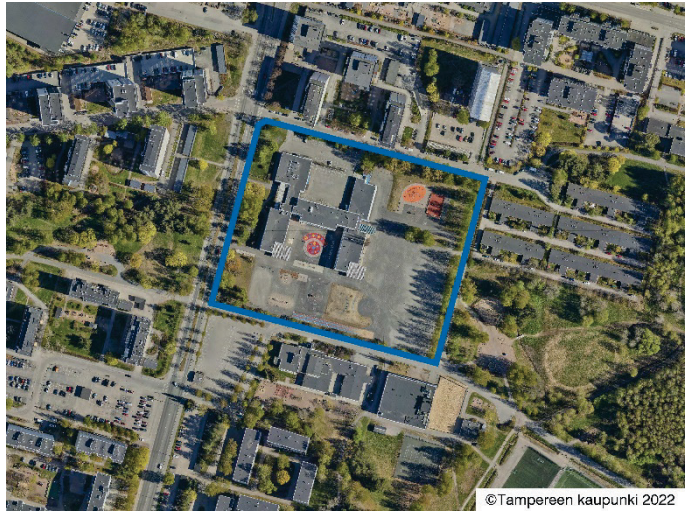
Suunnittelalueen rajaus ilmakuvassa.