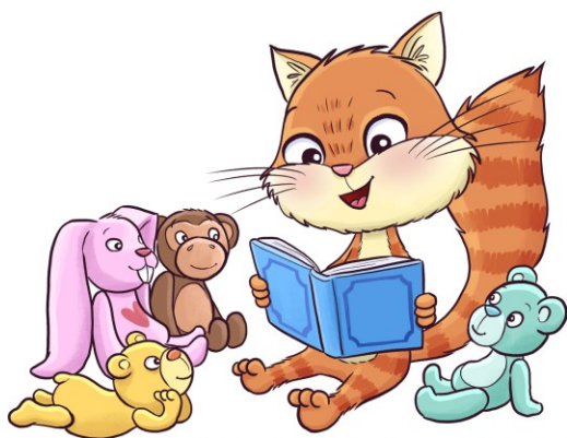
Kuva 2. Kirjatti lukee pehmoille

Päiväkotiryhmät voivat pyytää kirjastosta kirjavalikoimia eri aiheista. Päiväkodin henkilökunta hakee kirjat kirjastosta, kerättyjä aineistoja varten ei ole erillisiä kuljetuksia. Valikoimat voivat liittyä erilaisiin päiväkodissa käsiteltäviin teemoihin, kuten vuodenajat, värit, ystävyys tai avaruus. Suuria kirja- ja aineistolaatikoita voi tarvittaessa kysyä kirjastoauton palvelupäälliköltä, ellei päiväkodin lähellä ole lähikirjastoa tai kirjastoauto ei käy päiväkodin pihassa. Suurten aineistomäärien toimittamisesta päiväkotiin sovitaan tapauskohtaisesti.