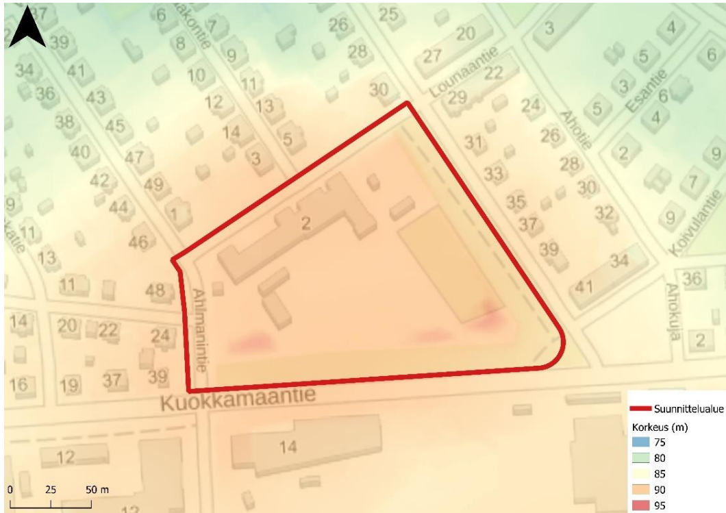
Kuva 3. Maanpinnan muodot selvitysalueella (korkeusmalli ja taustakartta: MML).

Pintavalunta-analyysillä 3 havaittiin, että koulun pihan hulevedet lammikoituvat jo tavanomaisilla sadetapahtumilla. Lisäksi koulun pihan hulevesien tulvareitti ohjautuu nykytilassa alueelle, jonne on suunniteltu täydennysrakentamista. Tulevassa tilanteessa tasausta tulee muuttaa niin, että tulvareitti voidaan ohjata koulun piha-alueelta kulkemaan koulurakennuksen ja pysäköintialueen välistä Lounaantielle. Selvitysalueen hulevedet päätyvä kaikilta osavaluma-alueilta hulevesiviemäreitä pitkin Iidesjärveen.