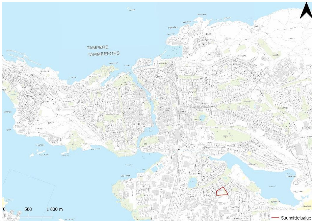
Kuva 1. Suunnittelualueen sijainti (Taustakartta: MML).

Suunnittelukohte sijaitsee osoitteessa Lounaantie 2 Tampereen Nekalassa, noin 2 km kaakkoon Tampereen keskustasta (Kuva 1). Asemakaavamuutos koskee Nekalan kaupunginosan korttelin 571 tonttia 1, sekä ajoväyliin rajautuvaa viheraluetta. Suunnittelualue rajautuu Lounaantiehen pohjoisesta, Erätiehen idästä, Kuokkamaantiehen etelässä ja Ahlmannintiehen lännessä. Suunnittelualue on pinta-alaltaan noin 2,3 ha.