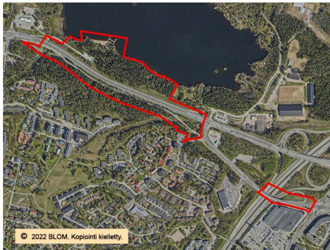
Suunnittelualue rajattu ilmapäätöseen.