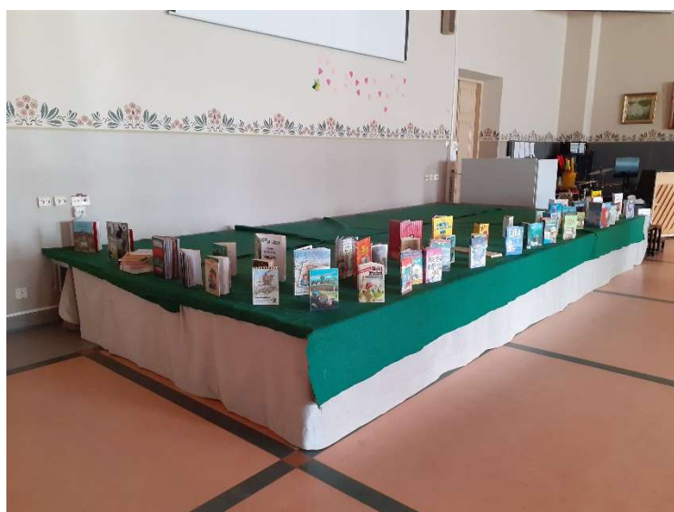
Alakoulun kirjastoagenttien keväällä 2023 järjestämällä lukuvälkällä oli tarjolla monipuolisesti luettavaa.