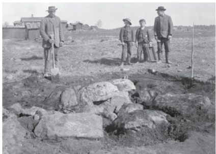
8. Kukkojenkivenmäen kalmisto vuonna 1909.