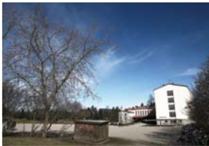
1. Kissanmaan koulu