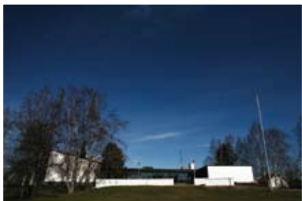
4. Uudenkylän seurakuntatalo