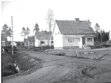
2. Ahmankadun vastavalmistuneet omakotitalot vuonna 1953.