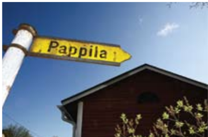
7. Takahuhdin pappila