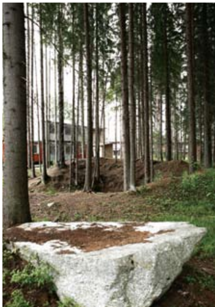
5. Mustavuoren puolustusvarustukset