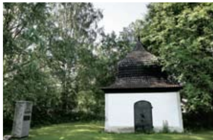
4. Gaddin kappeli