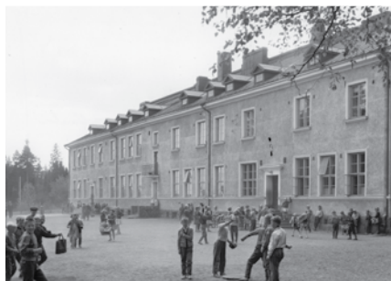
9. Lamminpään koulu, Kortesuontie 27