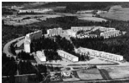
7. Kerrostalot Kohmankaaren varrella