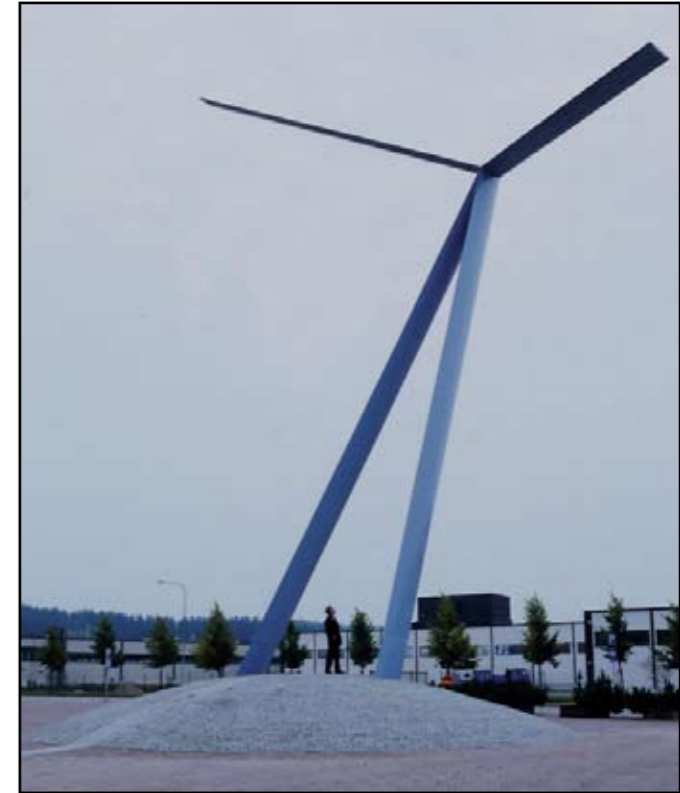
Leonardo / Härmälän lentokentän muistomerkki