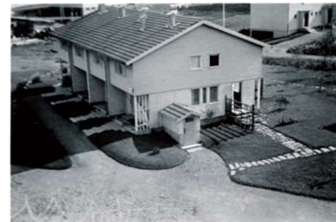
Majavankadun rivitalo lämpökeskuksen katolta kuvattuna. 1950-luvun lopulla.

Kimmo Kaivanto avioitui ja ensimmäinen lapsi syntyi 1954. Nuori perhe ehti asua Pikilinnassa vuoden verran, kunnes muutti Kissanmaalle vastavalmistuneisiin rivitaloihin. Perheen toinen lapsi syntyi 1956. Asunnon yhteydessä ei ollut erillisiä työtiloja.