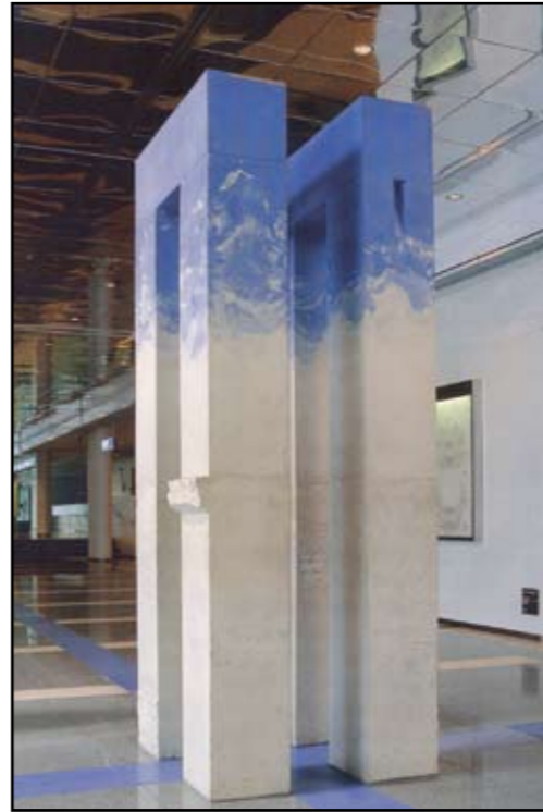
Sininen suora, osa Temppele