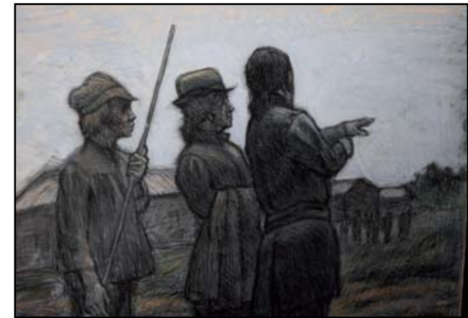
Yksityiskohta Tori-teoksen Tontin jako -osasta