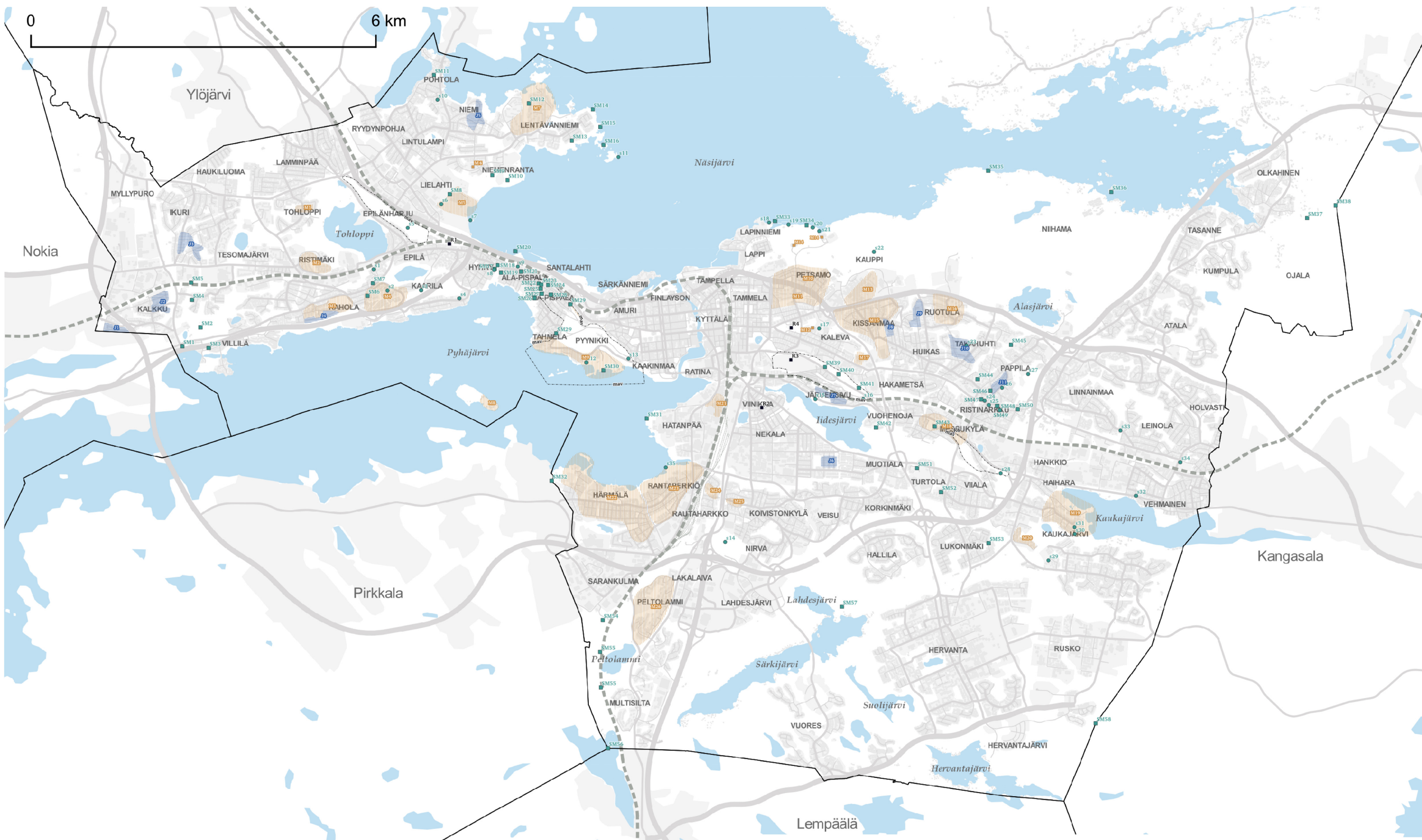
KARTTA 3 - KULTTUURIPERINTÖ

Hyväksytty kaupunginvaltuustossa 17.5.2021. Hallinto-oikeuden päätös valituksista 30.11.2022. Korkeimman hallinto-oikeuden päätös valituslupahakemuksesta 5.6.2023. Voimaantulojulutus 9.6.2023