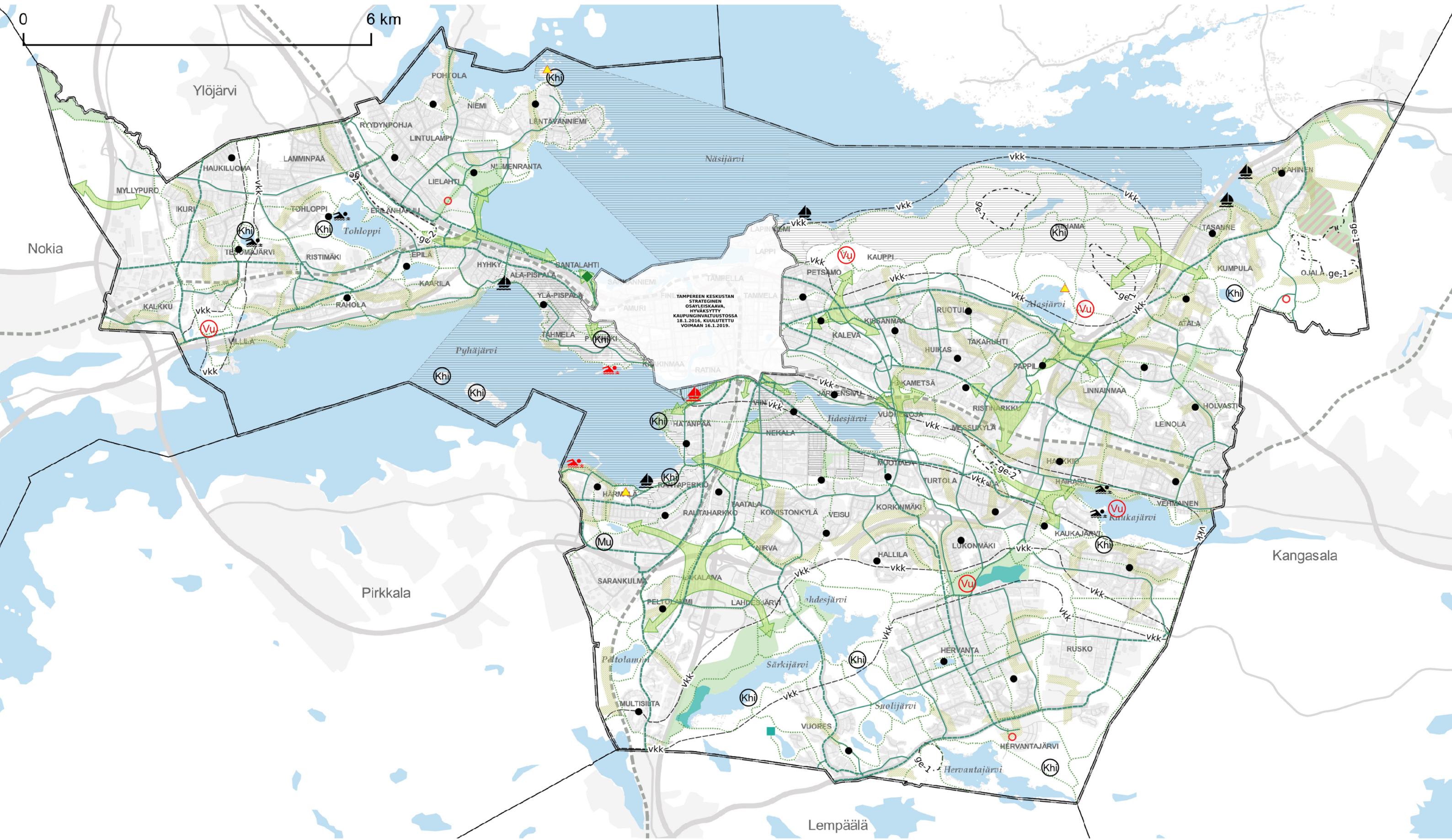
KARTTA 2 - VIHERYMPÄRISTÖ JA VAPAA-AJAN PALVELUT

Hyväksytty kaupunginvaltuustossa 17.5.2021. Hallinto-oikeuden päätös valituksista 30.11.2022. Korkeimman hallinto-oikeuden päätös valituslupahakemuksesta 5.6.2023. Voimaantuloakuulus 9.6.2023