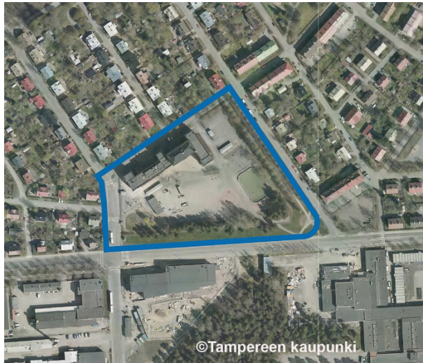
Kaava-alueen rajaus ilmakuvassa.