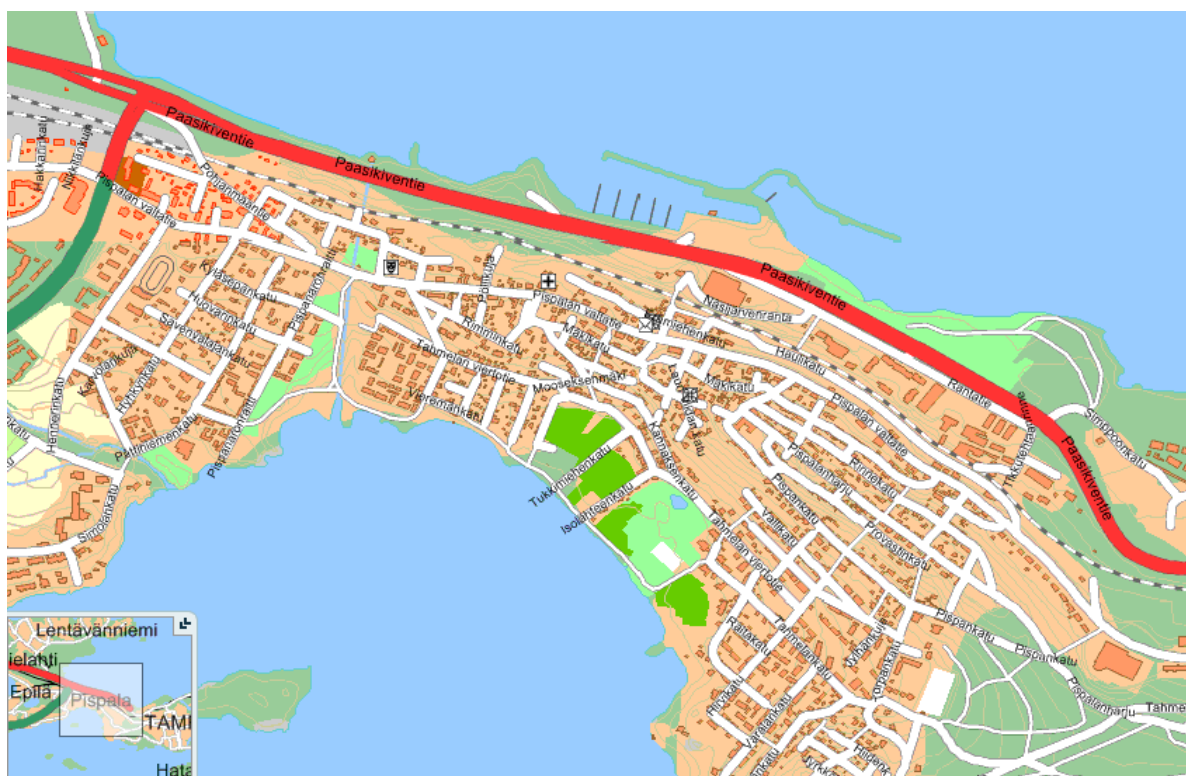
Kuva 1. Selvityskohde

Työssä laadittiin ilmanlaatuselvitys Tampereen Pispalan ja Santalahden kaupunginosien asema-kaava-alueille nro 8256 (Pispala, vaihe Ia), 8309 (Pispala, vaihe IIa), 8310 (Pispala, vaihe IIb) ja 8048 (Santalhti).