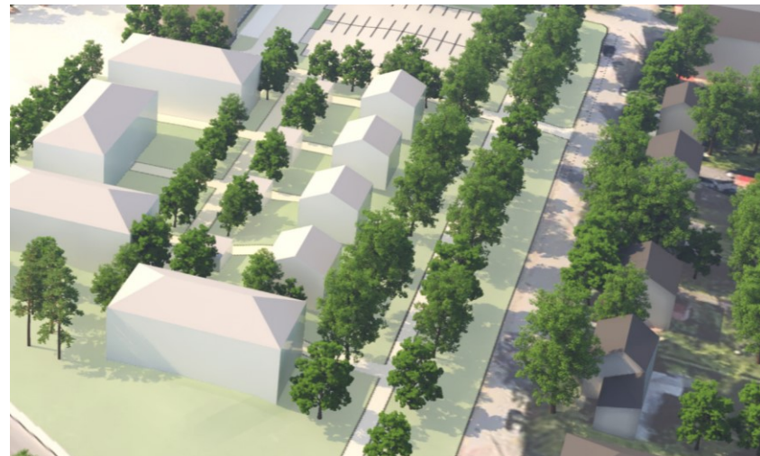
Pientaloihin saa rakentaa yhden asunnon. Rakennuksiin saa rakentaa kaksi kerrosta, katon on oltava satulakatto.

ym-8 Uudisrakennusten sopeutumiseen kaupunginosakokonaisuuteen ja katukuvaan on kiinnitettävä erityistä huomiota.