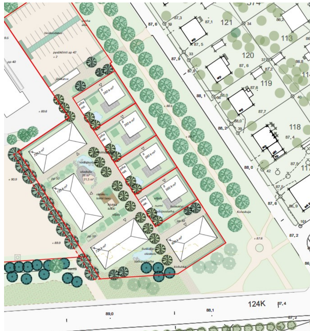
Ote koulun alueelle esitettyjen uusien asumisen tonttien pihasuunnitelmasta. Nomaji maisema-arkkitehdit Oy, 2023.

OHJE Tonteilta varataan tilaa hulevesien viivytykselle maan pinnalla.