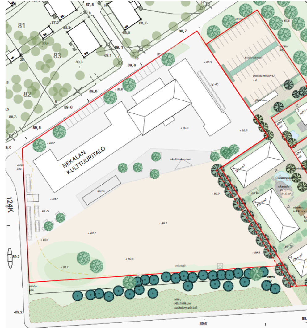
Ote asemakaavan 8861 pihasuunnitelmasta. Nomaji maisema-arkkitehdit Oy, 2023.

Tontilla on viivytettävä hulevesiä viherkerroinlaskelman mukaisesti. Viivytystilavuuden tulee tyhjentyä 3-12 tunnin kuluessa täyttymisestä ja järjestelmässä tulee olla suunniteltu ylivuoto.