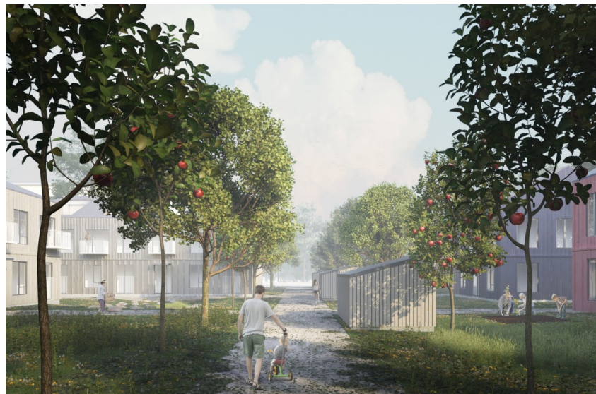
Pientalojen ja pienkerrostalojen rajaama piha-alue.