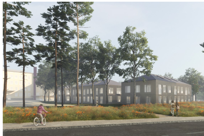
Pienkerrostaloihin saadaan rakentaa kaksi ja puoli kerrosta. Kattomuotona on satula- tai harjakatto ja julkisivumateriaalina puu.

ym-8 Uudisrakennusten sopeutumiseen kaupunginosakokonaisuuteen ja katukuvaan on kiinnitettävä erityistä huomiota.