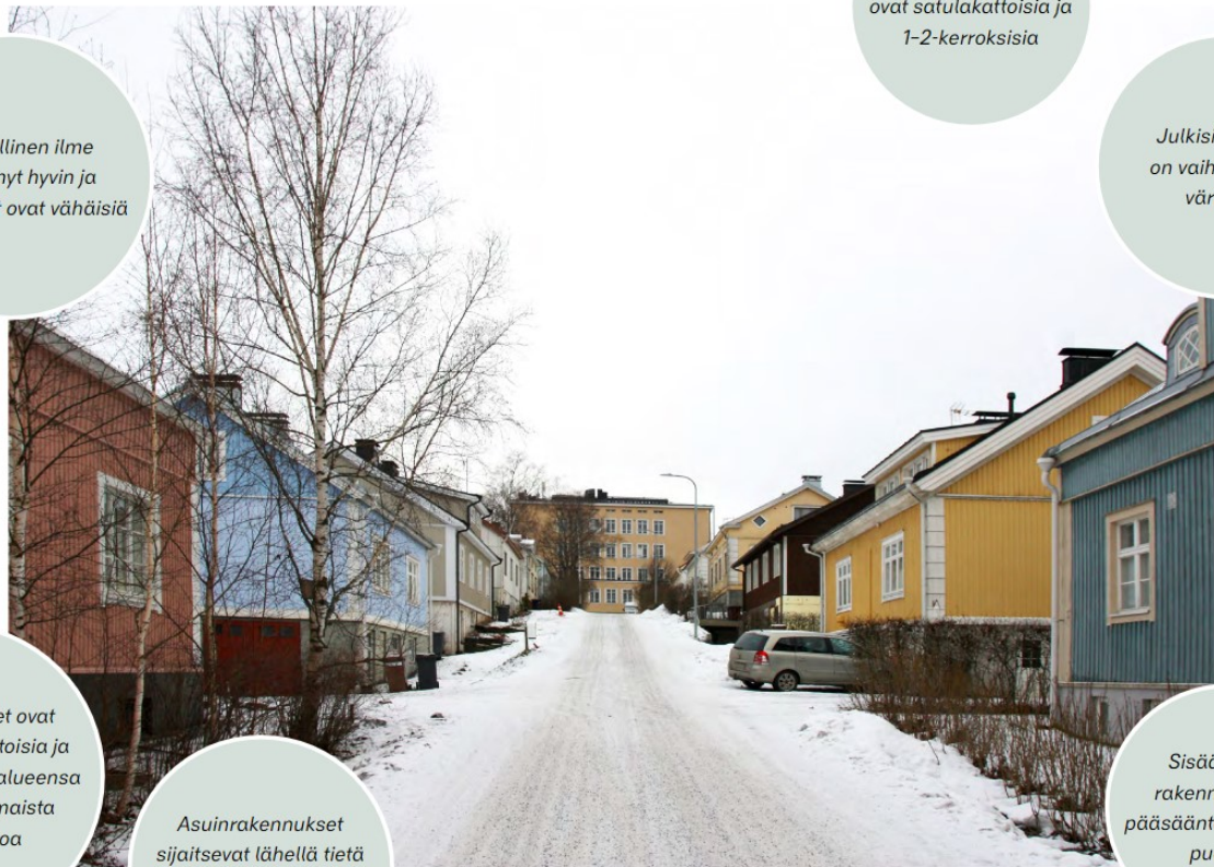
Nekalan koulun kaupunkikuvaselvitys | Tampereen kaupunki | INARO

Sisäänkäynti rakennuksiin on pääsääntöisesti pihan puolelta