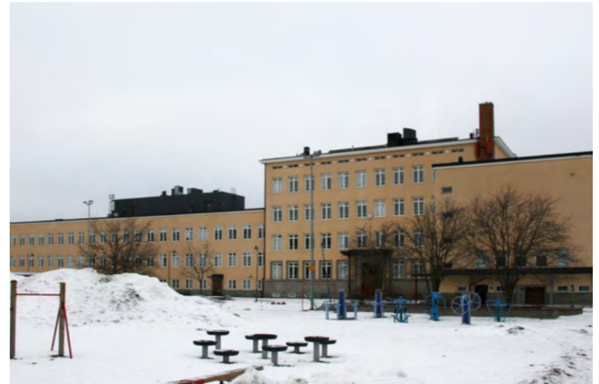
Nekalan koulu saa asemakaavassa suojelumääräyksen sr-8. Sen rakennustaiteellisesti ja kaupunkikuvan kannalta merkittävä luonne tulee säilyttää.

OHJE Ikkunoiden puitejako tulee säilyttää. Mikäli ikkunoita korvataan uusilla, uusien ikkunoiden tulee olla ilmeeltään entisten kaltaisia.