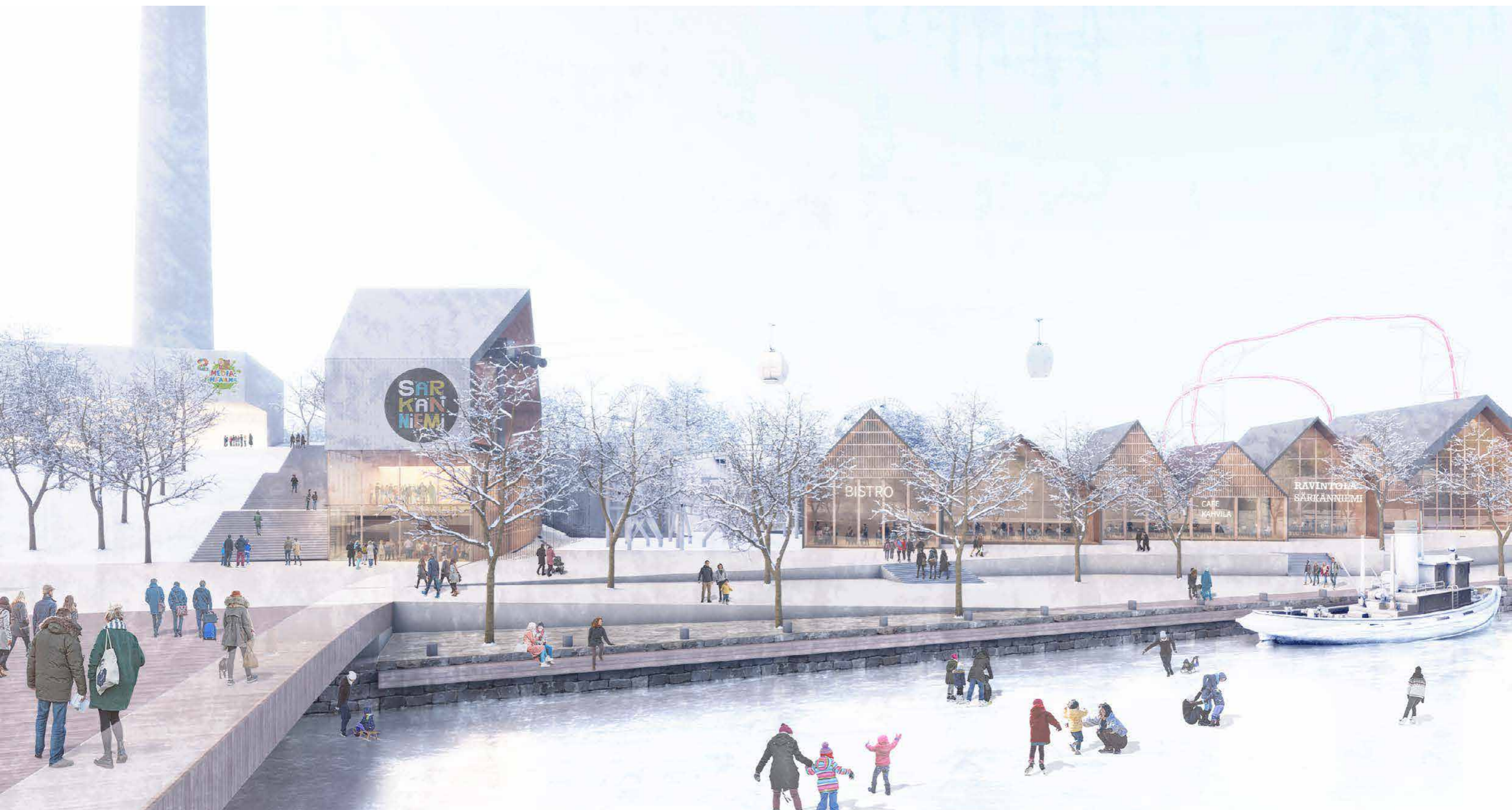
NÄKYMÄ SÄRKÄNNIEMEN RANTA-ALUEELLE TALVELLA