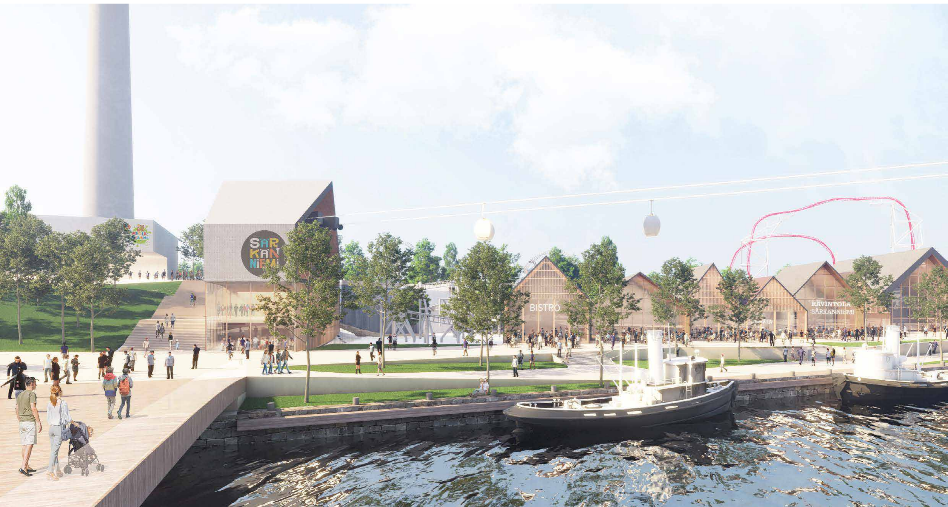
NÄKYMÄ SÄRKÄNNIEMEN RANTA-ALUEELLE