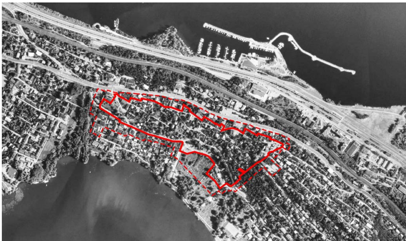
Kaava-alueet lähivaikutusalueineen; lähivaikutusalueet on merkitty punaisella katkoviivalla.

TRE: 842/10.02.01/2009 ja 1.2.2016 lähtien TRE:820/10.02.01/2016.