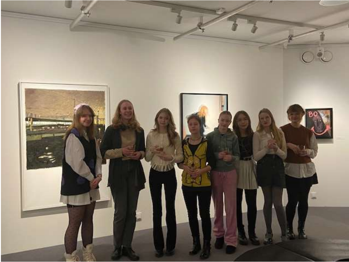
Kuvassa 8F-luokan kuvataideoppilaita.