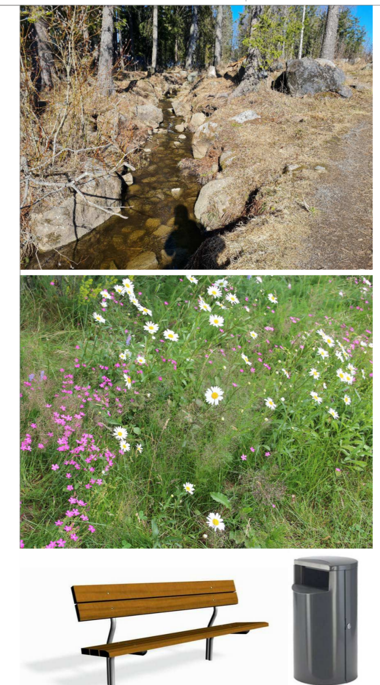
Uomaa kunnostetaan samantyyppiseksi, kuin ylävirran uoma. Paikkakäytävän lajistossa runsaasti kukkivia lajeja. Puiston varusteet Lappset Skandinavia penkki ja City@ 60 roska-astia