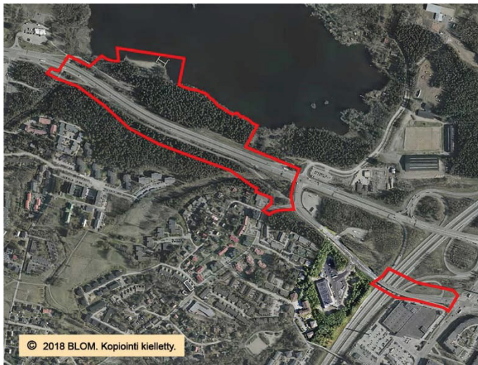
Suunnittelualue rajattu ilmakuvaan.