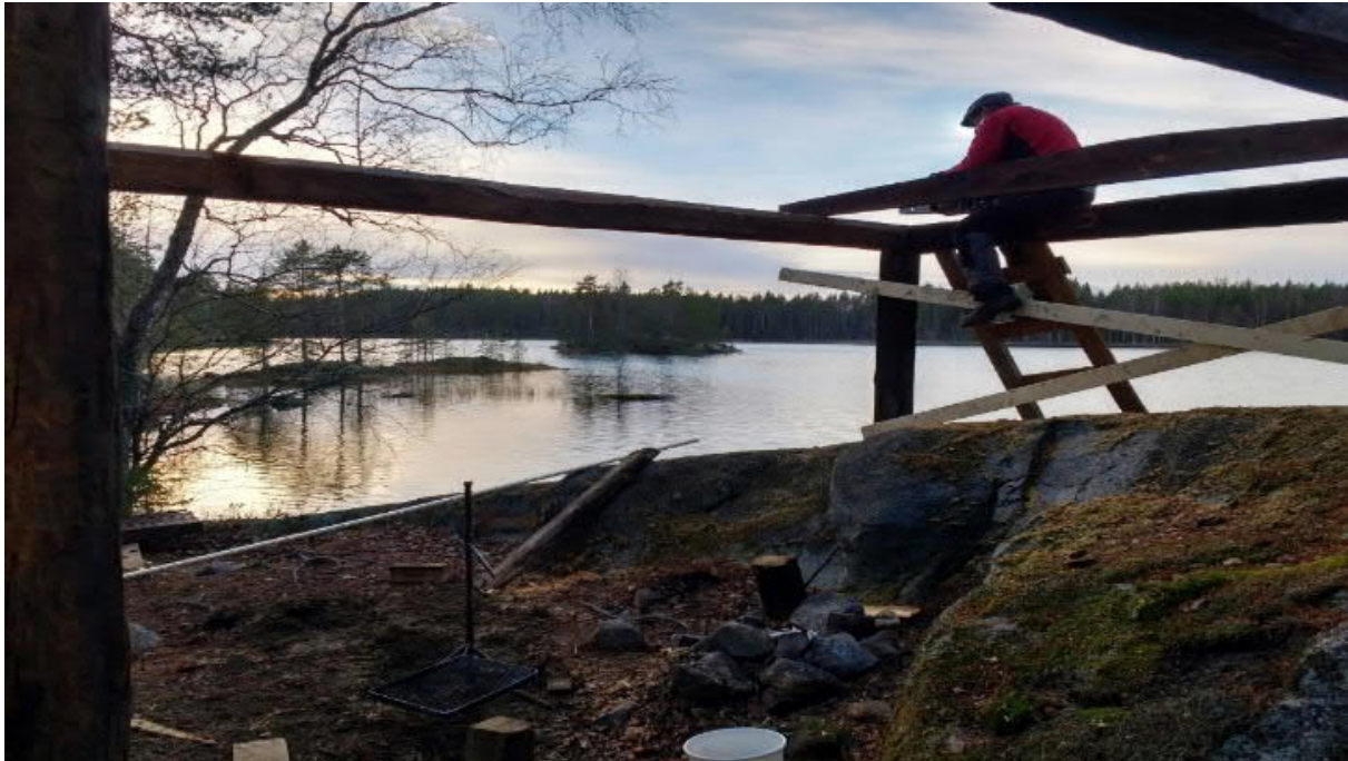
LUONTORAKENTAMISESSA RAKENTEET UPOTETAAN MAISEMAAN MAHDOLLISIMMAN HYVIN. SAARIJÄRVEN LAAVU RAKENTEILLA, KINTULAMMI 2017.