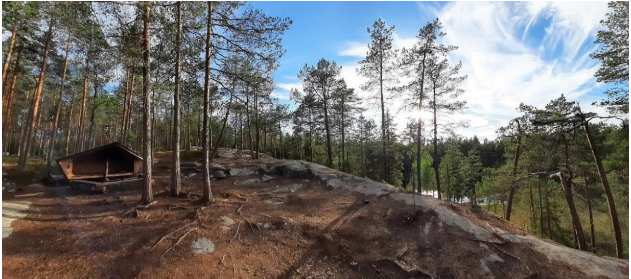
KAUKALOISTENKALLION LEIRIPAikka, KINTULAMMI