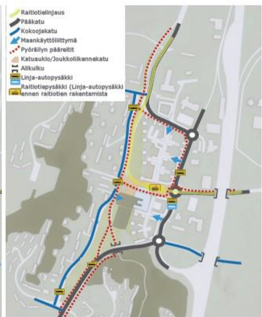
Maankäyttövaihtoehdon VE2 liikenneverkko