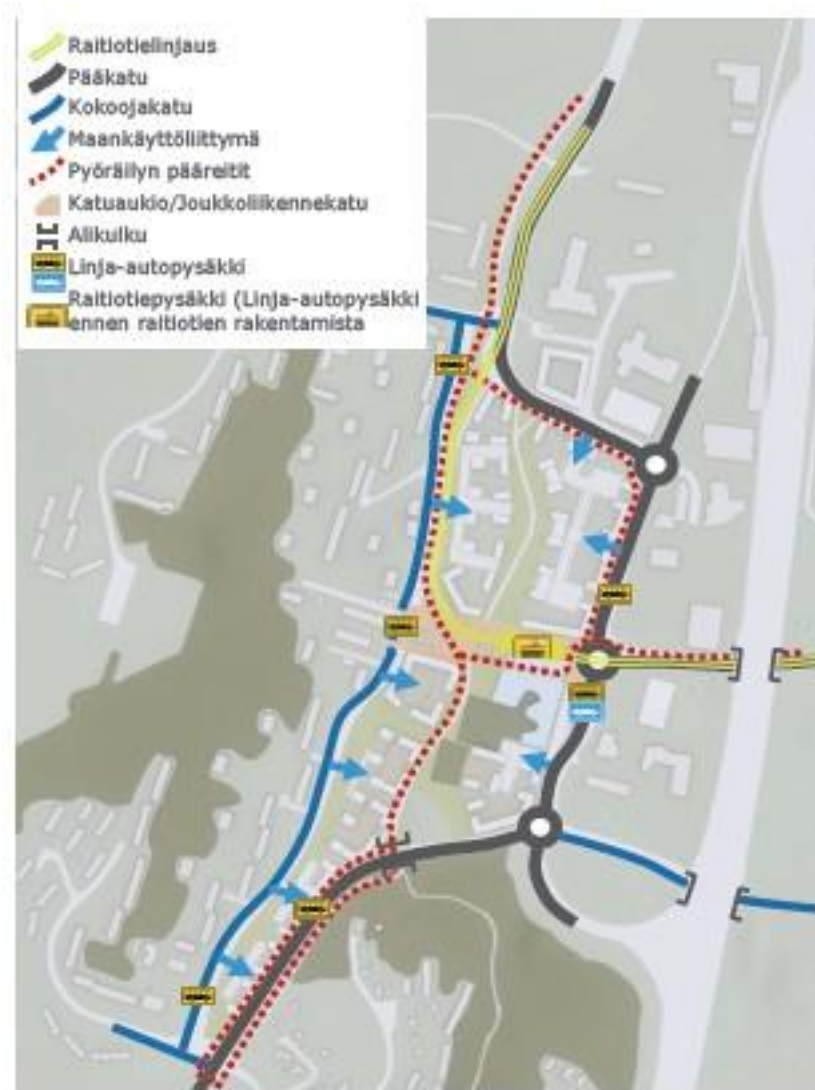
Maankäyttövaihtoehdon VE1 liikenneverkko

Automiehenkadulle sijoittuu joukkoliikenteen pysäkki (bussi, raitiotie)