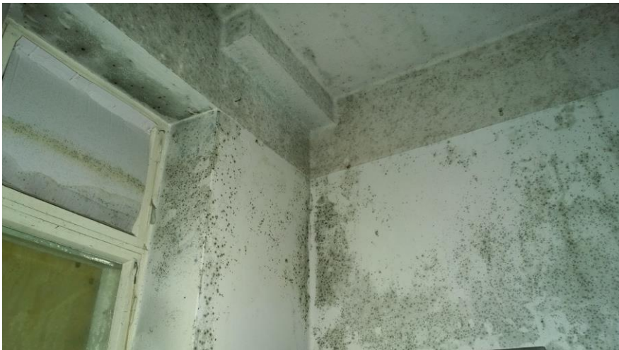
Kuva 18. Homehtuneita pintoja 1. kerroksen pohjoispään huoneissa.