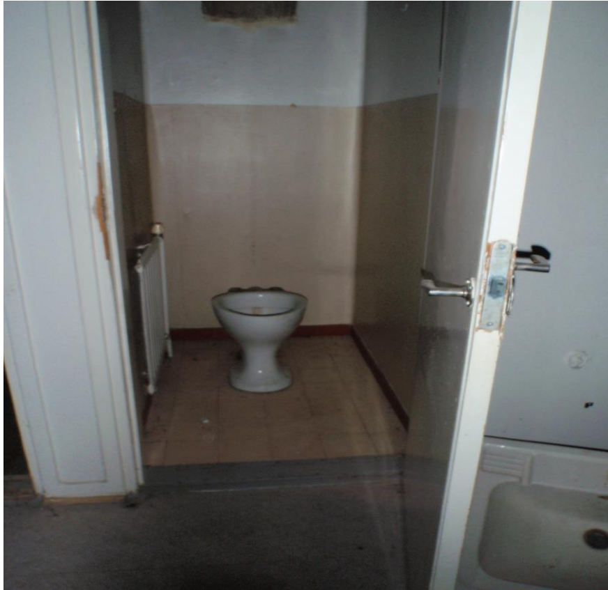
Kuva 29. Vanha ylähuuhtelusäiliöllä varustettu WC.