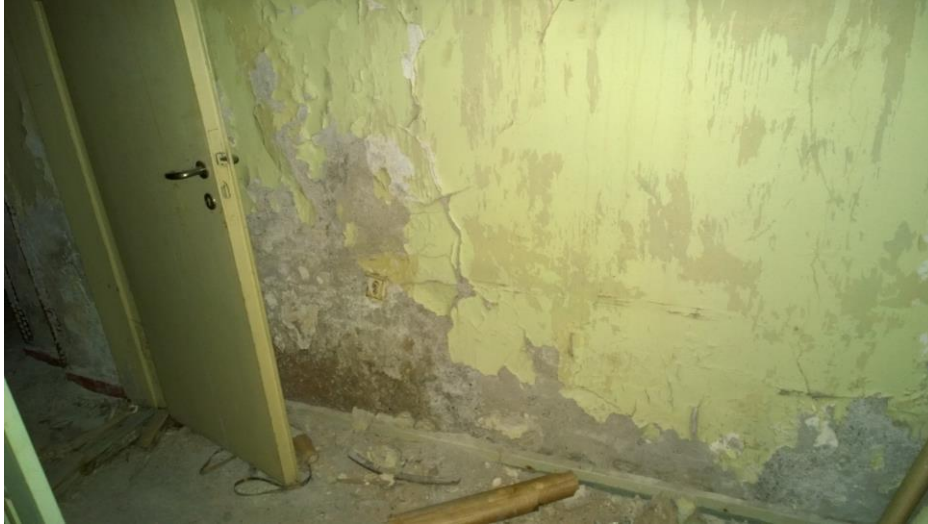
Kuva 3. Lämpöjohtokanavan vastaisen muurin alaosassa on kosteusvaurioita.