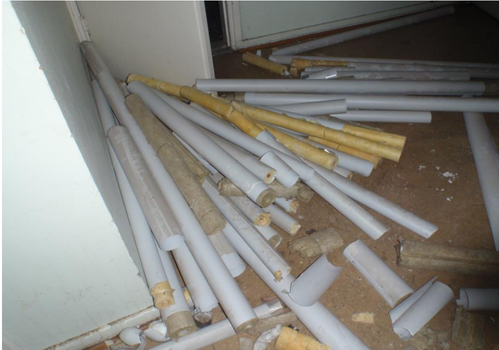
Kuva 27. Vesijohtojen eristeet jätetty lattialle.