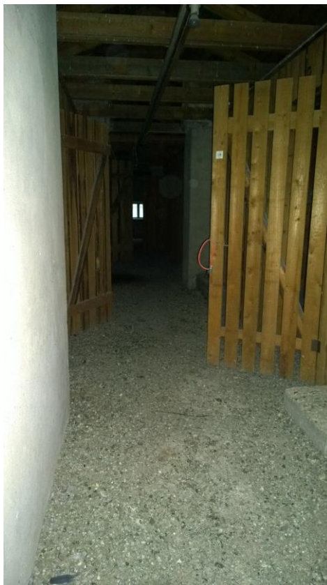
Kuva 14. Ullakon lattialla on runsaasti lintujen ulostetta.