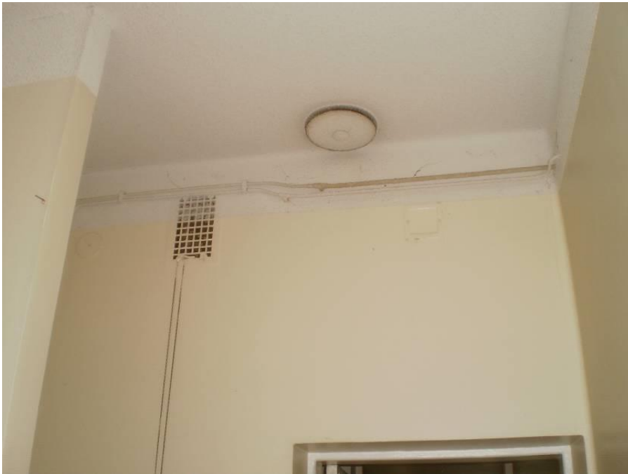
Kuva 34. Painovoimaisen ilmanvaihdon tulo- ja poistoventtiili.