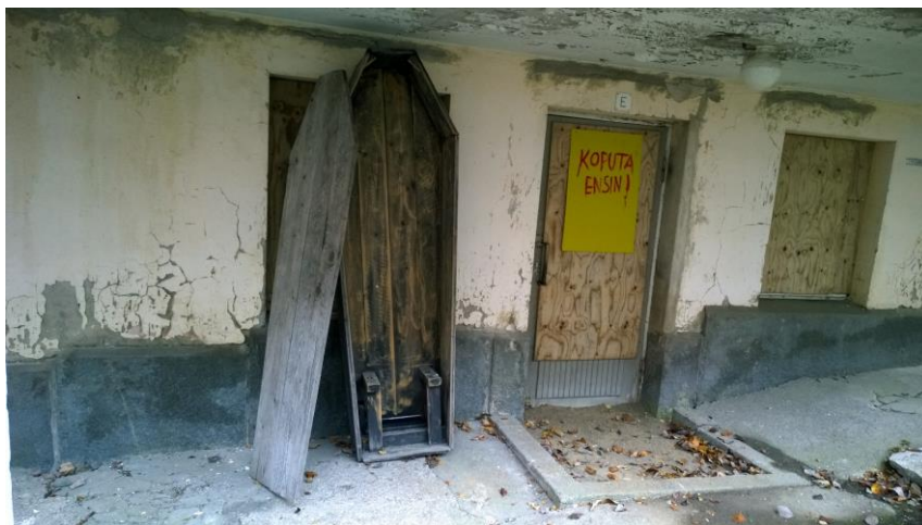
Kuva 2. Rakennuksen pohjoispäädyn graniittisokkeli.