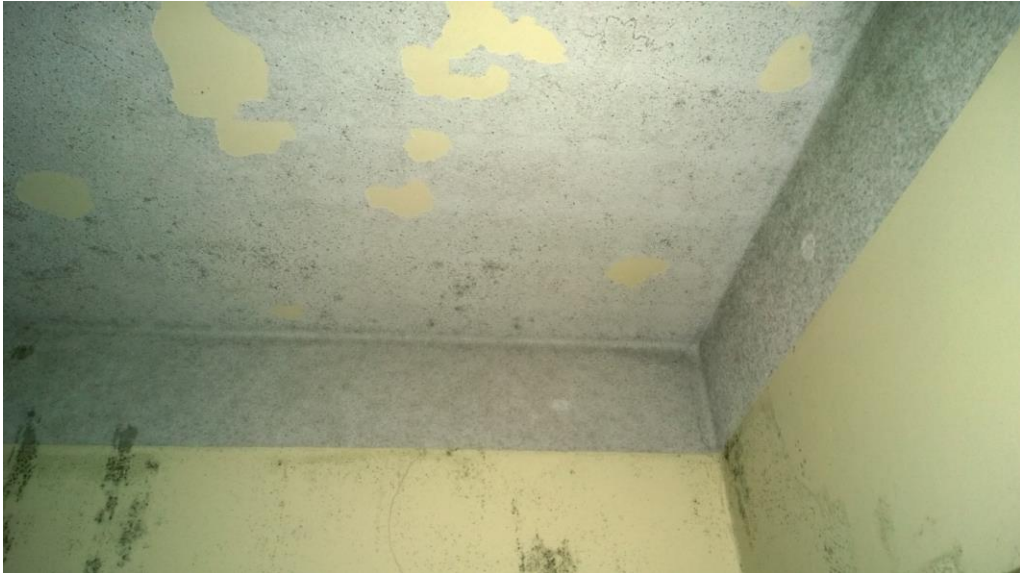
Kuva 21. Tasoite ja maali ovat irronneet katosta kosteuden takia.