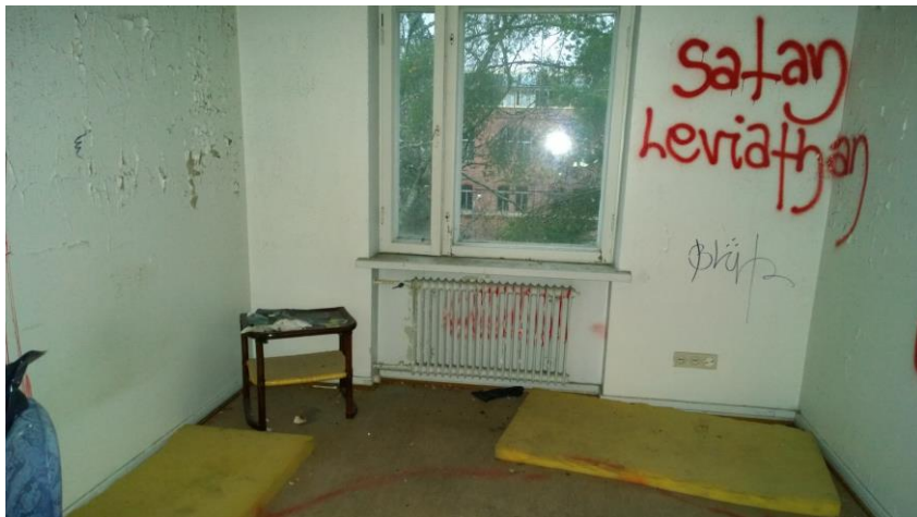
Kuva 15. Töherryksiä ja hilseileviä maalipintoja.