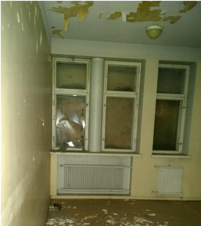
Kuva 19. Maalipinnat irtoavat katosta.