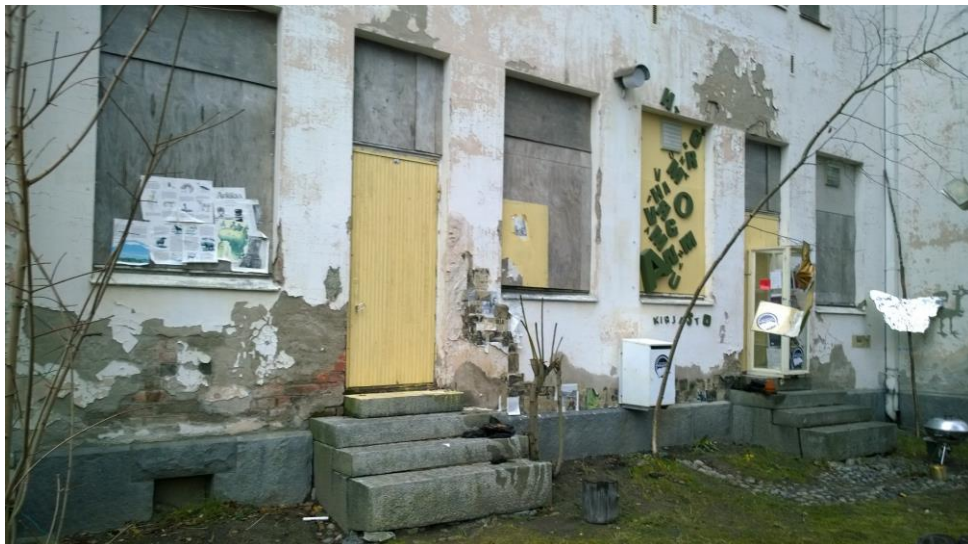
Kuva 9. Ikkunat on levytetty umpeen.