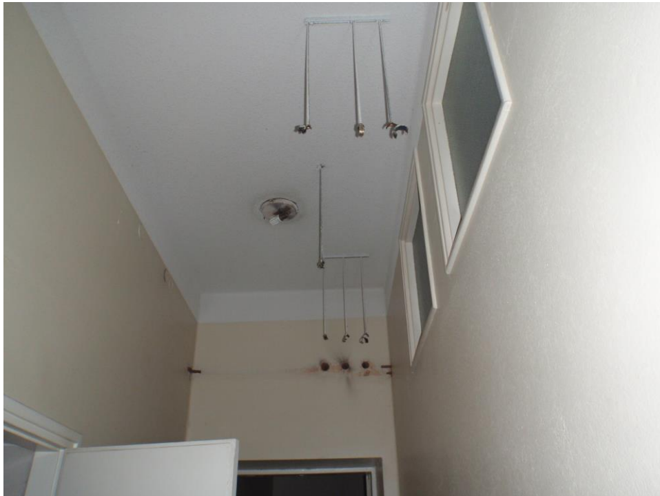
Kuva 26. Vesijohtojen kannakkeet, joista putket purettu.