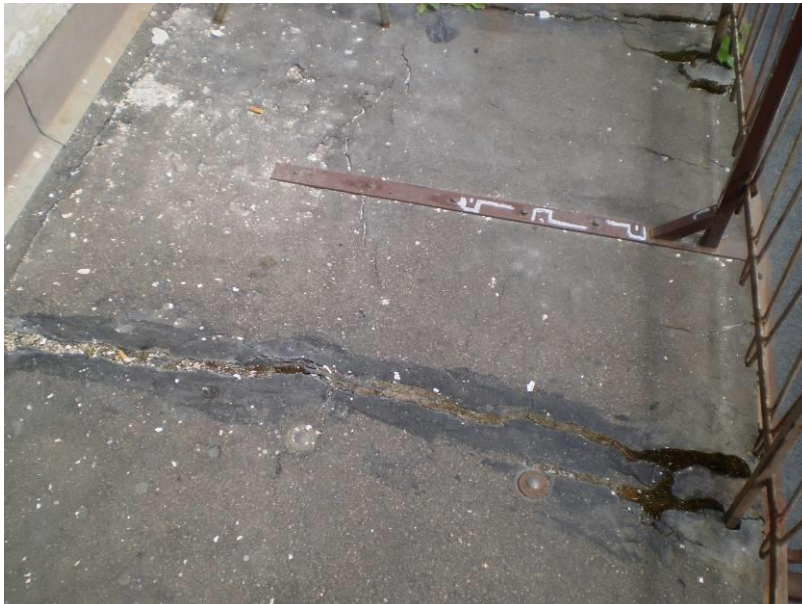
Kuva 11. Terassien kaiteiden kiinnitys laattaan on heikentynyt. Yläpinnan valuasfaltissa on vuotavia halkeamia (kuva vuodelta 2009).