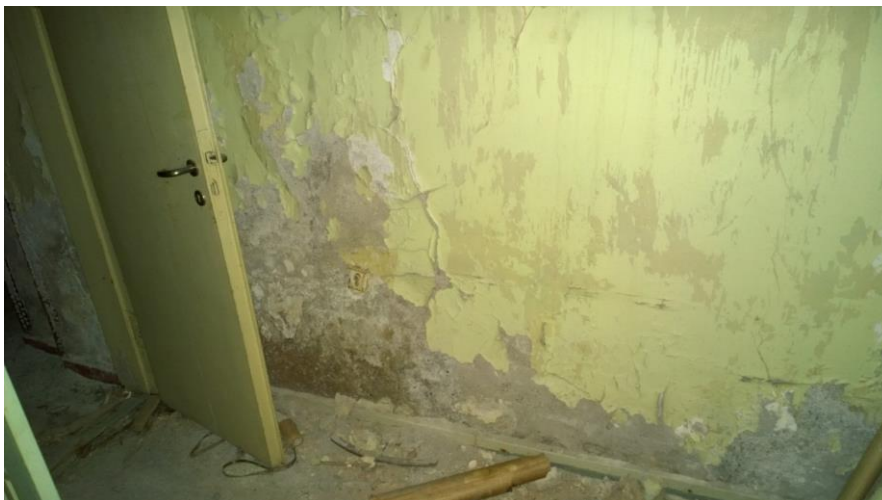
Kuva 5. Kellarin väliseinien alaosissa on kosteuden aiheuttamaa kalkkihärmää ja maalin hilseilyä.