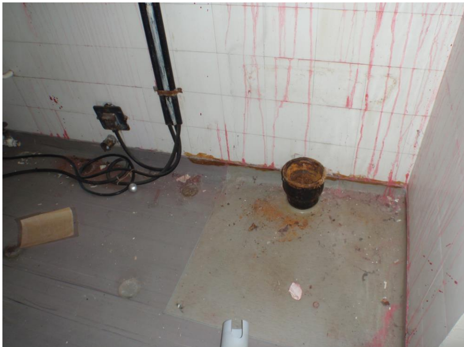
Kuva 24. Vanhan keittiön viemäriputki.