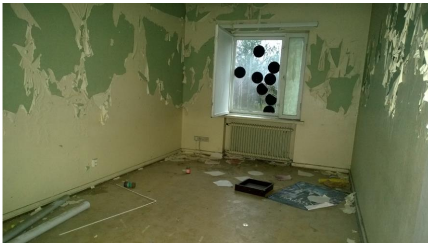
Kuva 16. Irtoavia maalipintoja.