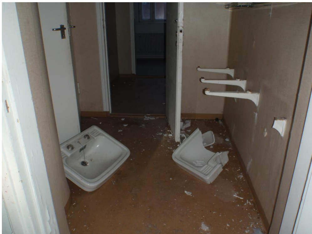
Kuva 28. Huoneiden pesualtaat.