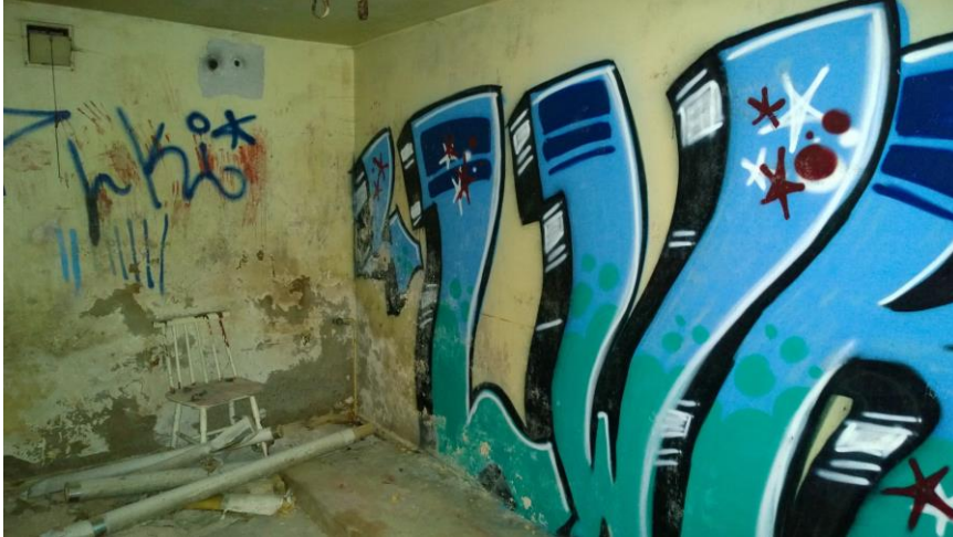
Kuva 17. Graffiteja kellarikerroksen seinissä.