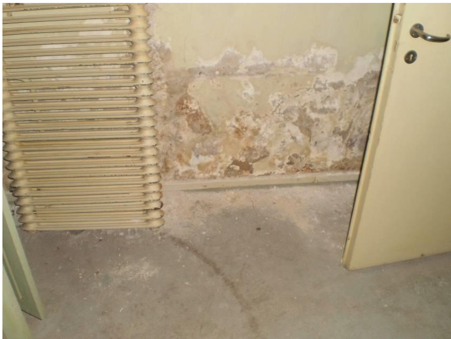
Kuva 25. Kellarin seinässä on kosteusvaurioita.