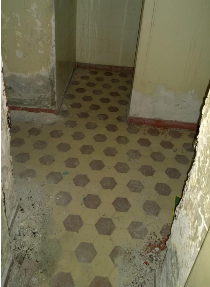
Kuva 4. Lattialaatan klinkkerilaatoitus ja kosteuden aiheuttamaa rapautumaa.