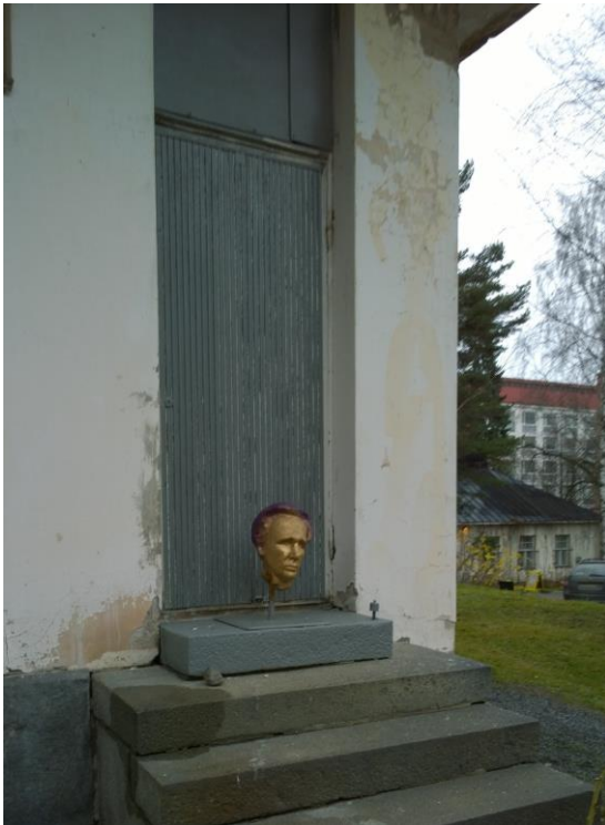
Kuva 10. Tyypillinen ulko-ovi.