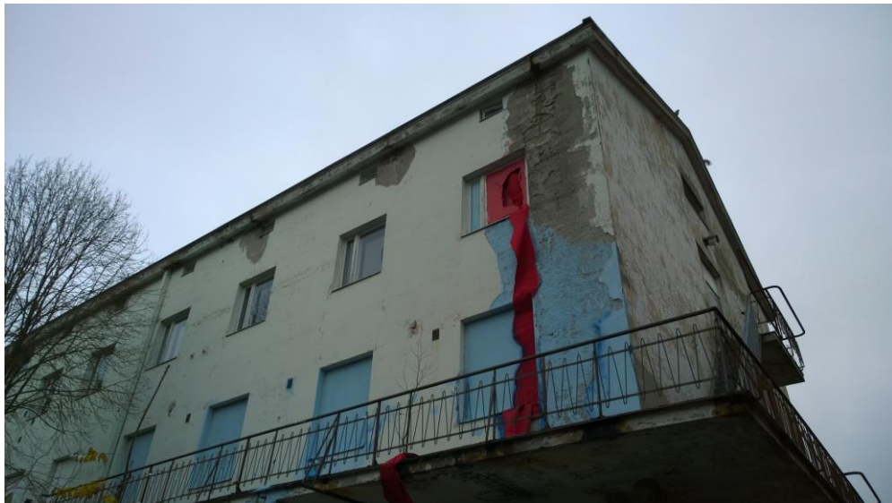
Kuva 6. Rakennuksen länsisivulla on näkyvissä lämpöliikkeiden aiheuttama halkeama.