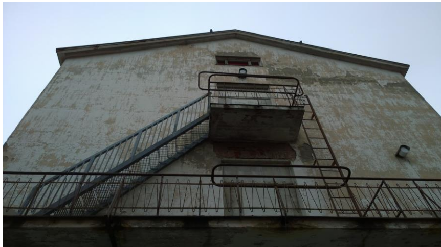
Kuva 7. Rappauspintojen rapautumista rakennuksen pohjoispäädyssä.