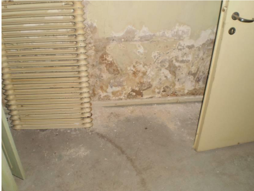
Kuva 1. Kellarin seinässä on kosteusvaurioita.