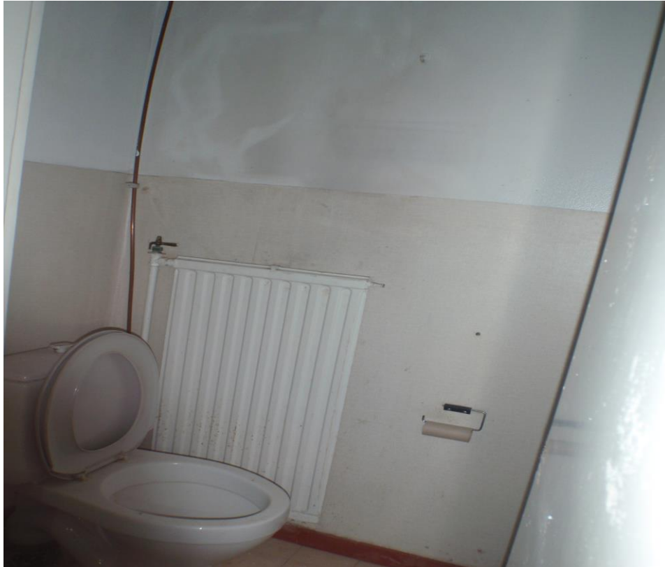
Kuva 32. Levypatteri ja vanha patteriventtiili