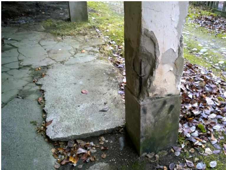
Kuva 13. Pohjoispäädyn pilareissa on voimakasta teräskorroosiota ja rapautumaa.