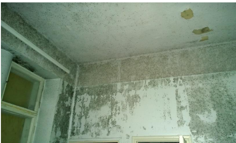
Kuva 20. Seinät ja kattopinnat ovat kostuneet ja homehtuneet puutteellisen ilmanvaihdon takia.