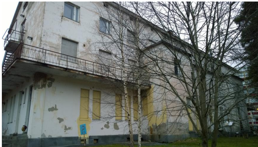
Kuva 8. Rakennuksen itäpuolen julkisivu.