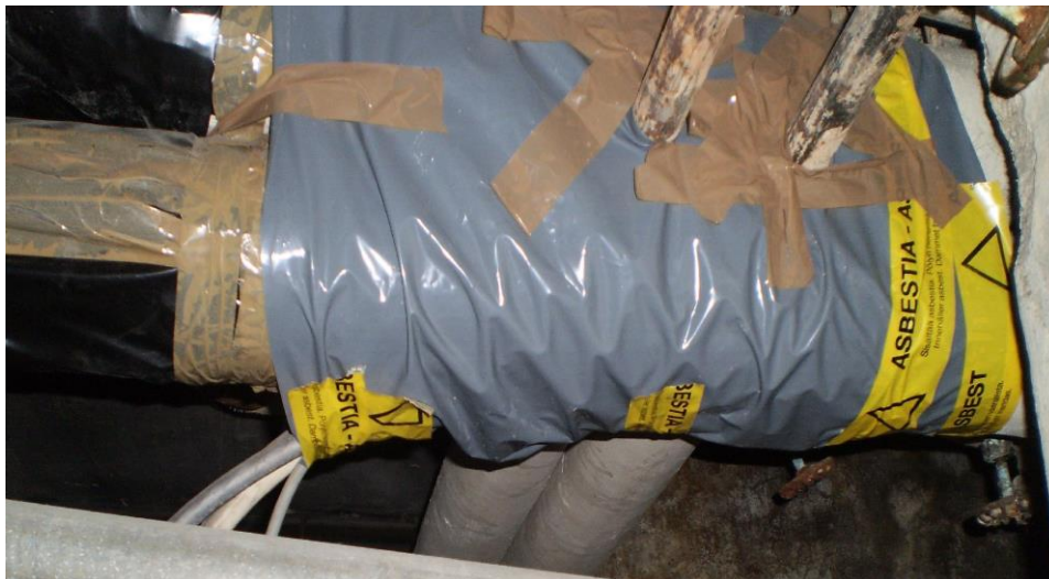
Kuva 33. Lämpöjohtot kanaalissa.