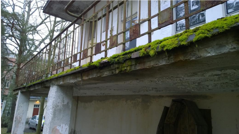
Kuva 12. Terrassin laatasta on runsaasti pakkasvaurioita.