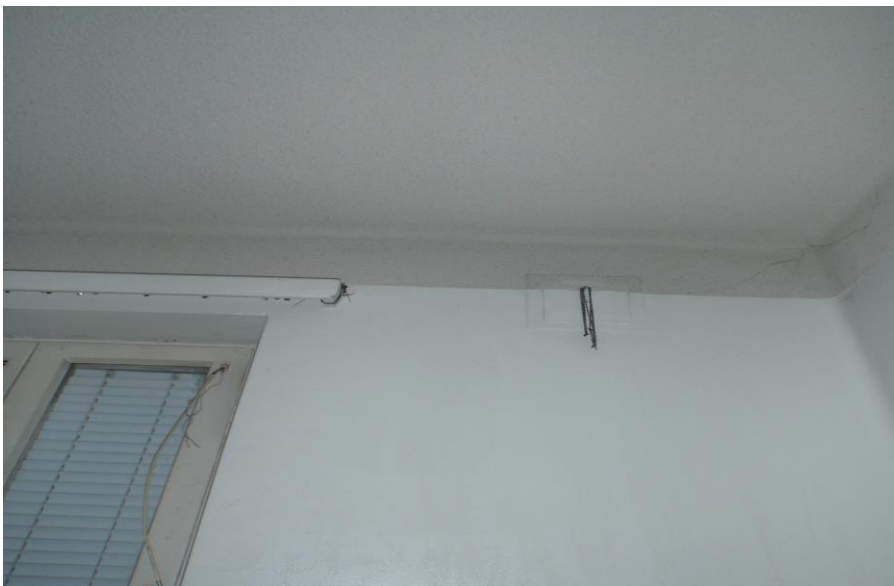
Kuva 35. Painovoimaisen ilmanvaihdon tuloilmaräppänä.