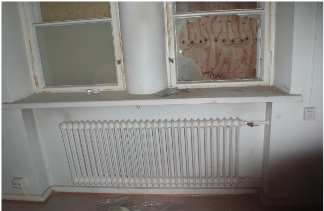
Kuva 31. Valurautainen patteri ja vanha patteriventtiili