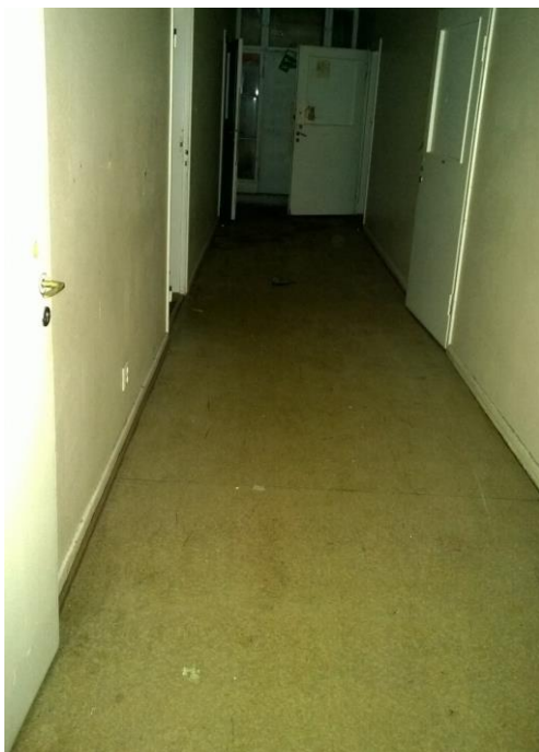
Kuva 22. Käytävän tyypillinen lattia.