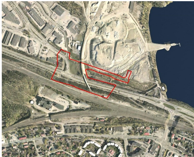
Suunnittelualueen rajaus ilmakuvassa.