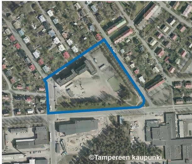
Kaava-alueen rajaus ilmakuvassa.