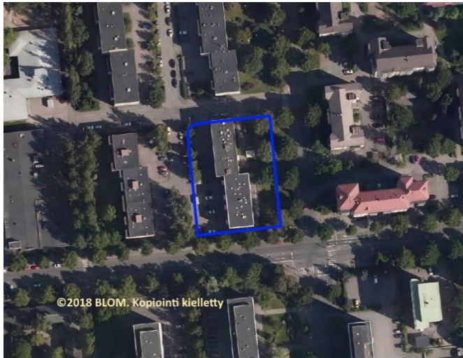
Kuva: Ilmakuva alueesta