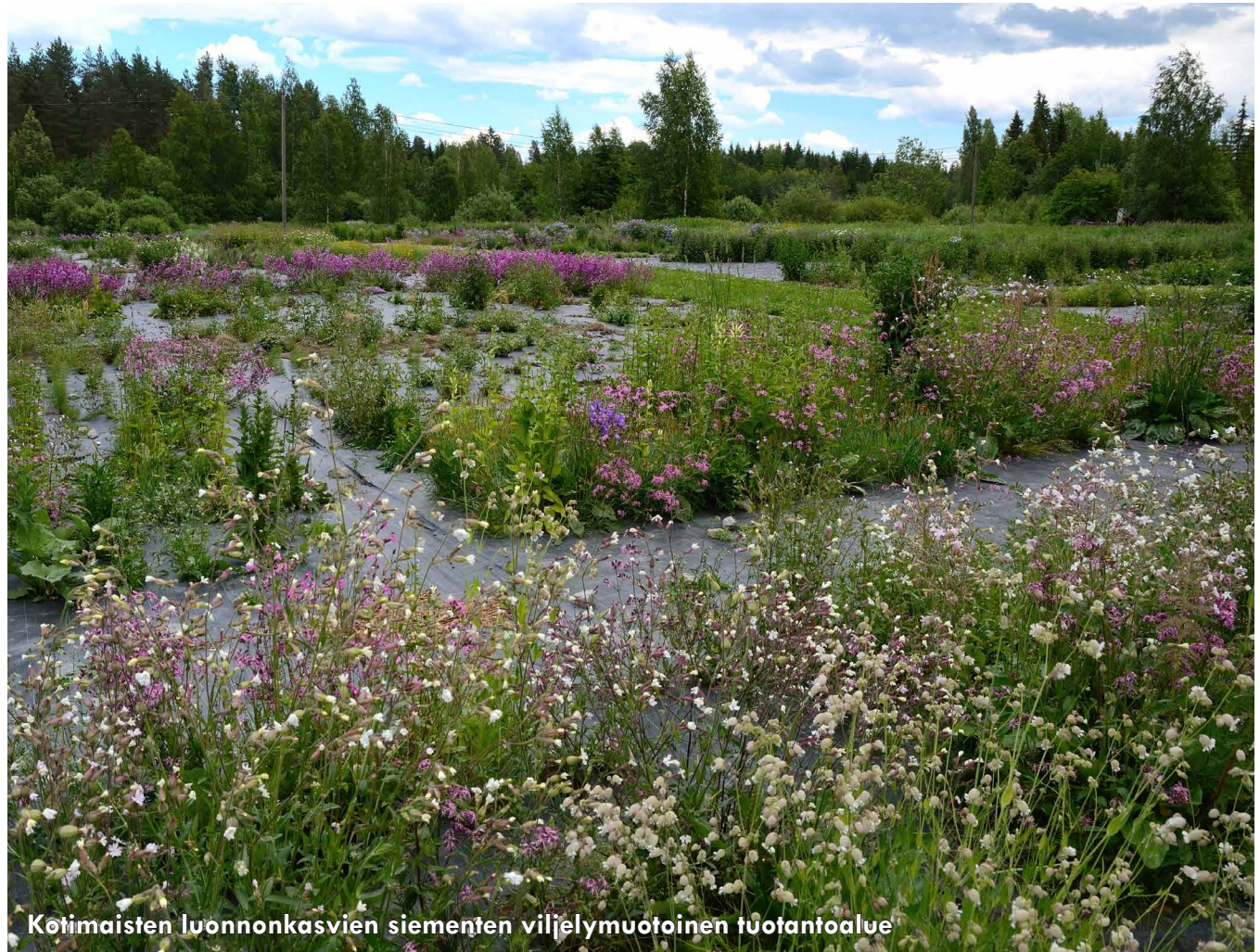
Kotimaisten luonnonkasvien siementen viljelymuotoinen tuotantoalue

Erityisesti harvinaisimpia ja vaateliaampia kasvilajeja kannattaa kasvattaa kontrolloiduissa olosuhteissa, jotta pienen populaation siementen itäminen ja mahdollisesti kasvuolosuhteiltaan vaativan kasvin kasvu voidaan varmistaa. Siementen käyttöön sisältyy myös siementen avulla toteutettu luonnonkasvien taimikasvatus. Viljelymuotoisessa siementen tuottamisessa tuotantolohkojen kasvustot on usein perustettu taimia istuttamalla.