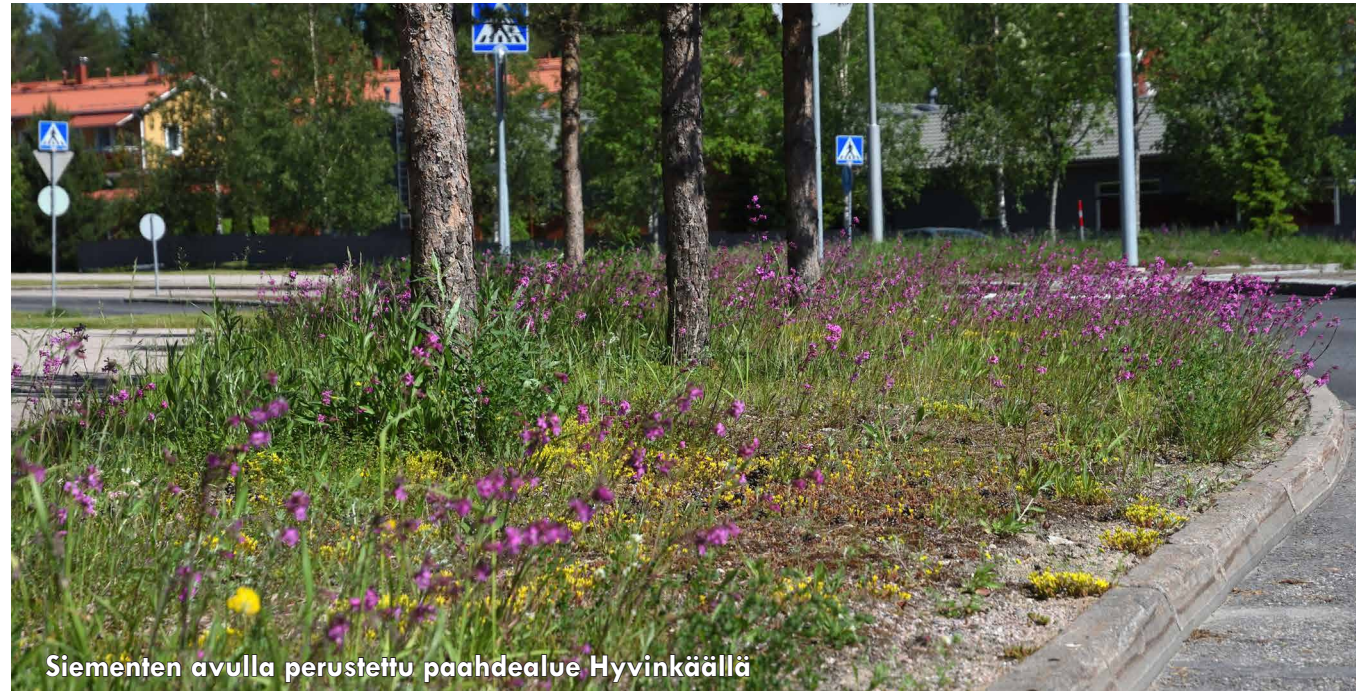
Siementen avulla perustettu paahdealue Hyvinkäällä

Ekologisten kriteerien tarkentamisella ja siementen alkuperän jäljitettävyyttä lisäämällä saadaan viheralueille tuotettua toimintoja, jotka tekevät niistä vahvoja ratkaisuja luontokatoon. On myös paikallisia kasvilajeja, jotka ovat harvinaisia mutta eivät välttämättä uhanalaisia. Myös harvinaisten kasvilajien vaaliminen on tärkeää, jotta niistä ei tulevaisuudessa tule uhanalaisia.