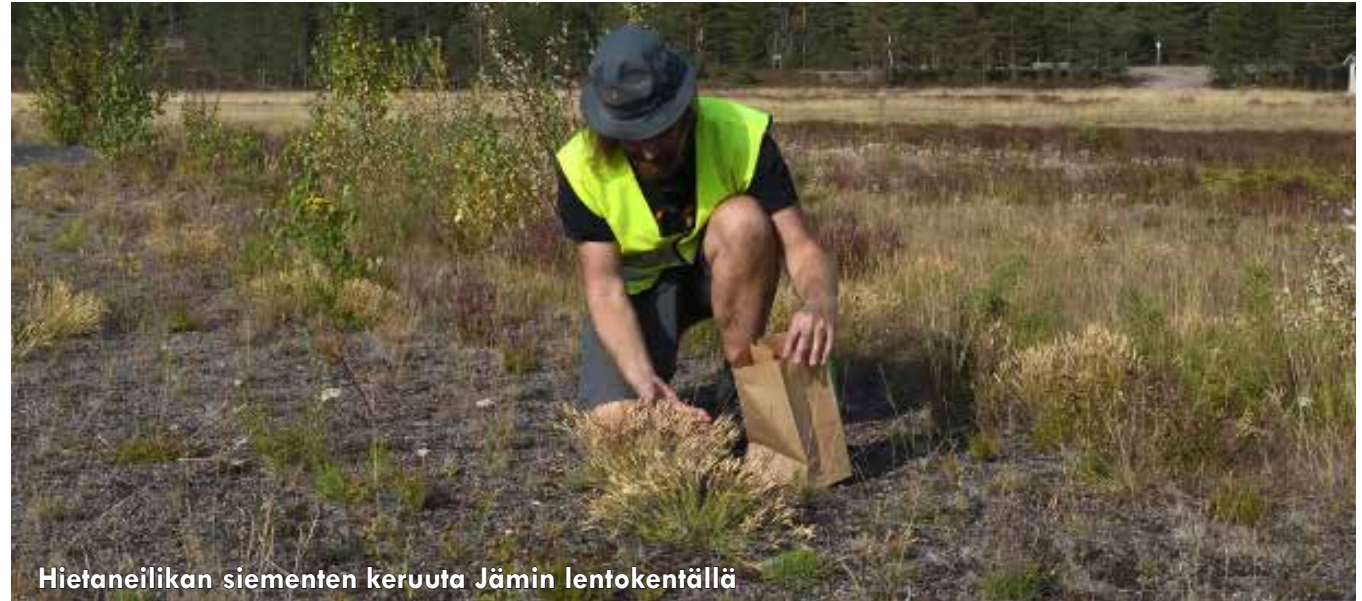
Hietaneilikan siementen keruuta Jämin lentokentällä

Sopiva kerutapa tulee arvioida kasvilajikohtaisesti. Yleensä pienillä ja muiden kasvien seassa kasvavilla esiintymillä keruu tapahtuu käsin. Koneellinen kerääminen soveltuu paremmin laajoille ja yhtenäisille kasvustoille.