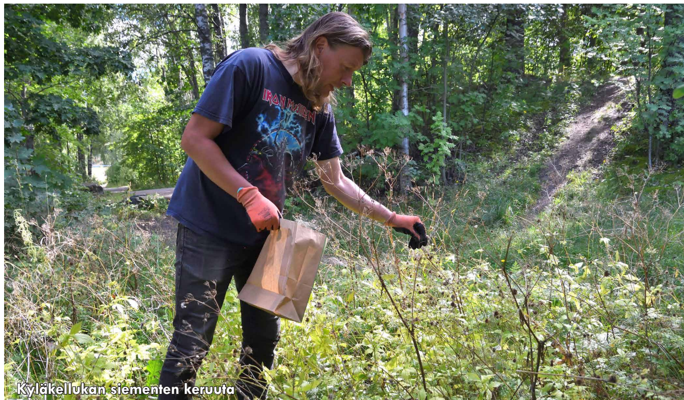
Kyläkellukan siementen keruuta

Yksivuotisten kasvien samasta populaatiosta ei tulisi kerätä siemeniä peräkkäisinä vuosina (Pedrini ym. 2020). Uhanalaisimpien kasvilajien – joiden populaatiot ovat vähäisiä – siemeniä tulisi kerätä eri yksilöistä, jotta geneettinen monimuotoisuus säilyisi (Way ja Gold 2014).