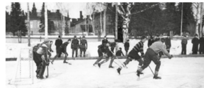
Ilveksen A-junioreiden ottelu vuonna 1942 Eteläpuistossa.