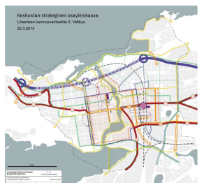
Keskustan strateginen osayleiskaava, luonnosvaiheen palauteraportti Tampereen kaupunki / Kaupunkiympäristön kehittäminen / Maankäytön suunnittelu